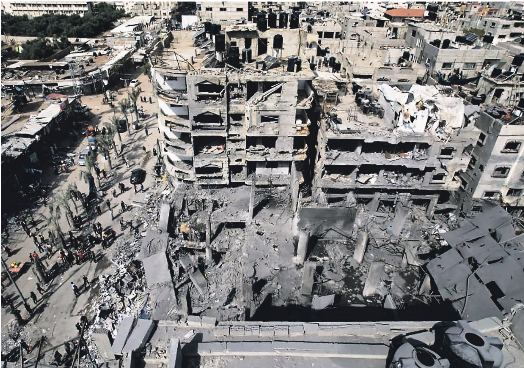
Ближний Восток оказался на грани крупномасштабной войны (на фото — разрушенный в результате обстрела рынок в секторе Газа)

Израиль 7 октября 2023 года столкнулся с масштабным терактом. В результате атаки бойцов палестинского движения ХАМАС за сутки в Израиле погибли около 1,2 тыс. человек, 251 оказался в заложниках. Впрочем, генсек ООН Антониу Гутерреш тогда подчеркнул, что нападение ХАМАС произошло «не из вакуума», а в том числе потому, что палестинский народ 56 лет подвергается оккупации. Уже 9 октября Израиль ввёл полную блокаду сектора Газа, а 25 октября ЦАХАЛ начал наземную операцию. Спустя год боевых действий под его контролем находится большая часть сектора. Но ХАМАС так и не ликвидирован, а в заложниках всё ещё находится 101 человек. В результате боевых действий в Газе, по данным палестинской стороны, погибли более 41 тыс. мирных жителей. 1 октября ЦАХАЛ расширил боевые действия, начав операцию на юге Ливана, откуда союзник ХАМАС – движение «Хезболла» обстреливало израильские поселения. ВВС Израиля наносят удары по Ливану больше месяца. В результате уничтожена вся верхушка «Хезболлы», но помимо них ещё около 2 тыс. человек. Территория Израиля также подвергается обстрелам и не только «Хезболлы», но и йеменских хуситов и Ирана. Многие политики предупреждают, что Ближний Восток оказался на грани крупномасштабной войны, в которую в итоге могут быть втянуты не только региональные игроки. В годовщину конфликта «Известия» взяли интервью у представителей Израиля, Ливана и Палестины, которые выразили свою точку зрения на последние события и рассказали, как они видят выход из сложной ситуации.