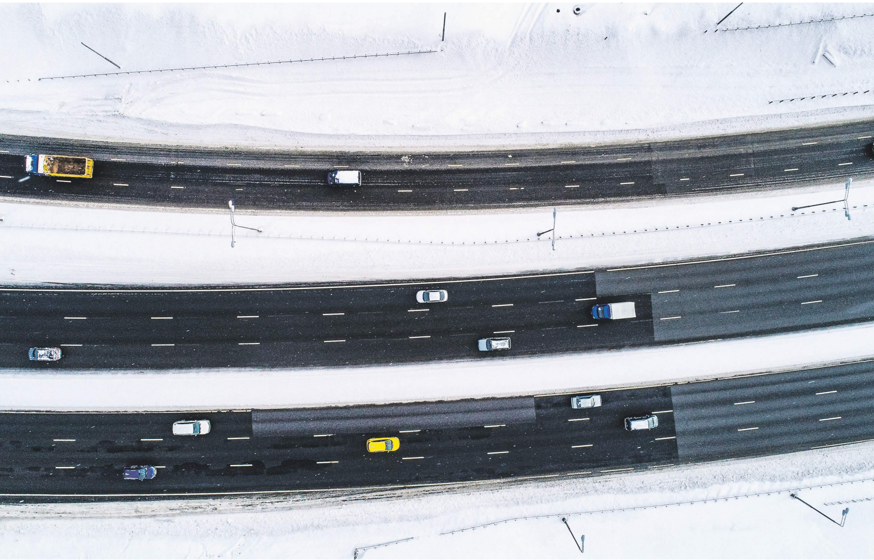
Почти 40% пенсионных накоплений «молчунов» вложено в транспортную отрасль и строительство дорог

Корпорация «ВЭБ.РФ» по запросу «Известий» впервые раскрыла отраслевую структуру инвестиций пенсионных накоплений 38 млн россиян. Половина общего расширенного портфеля приходится на корпоративные облигации и составляет более 1 трлн рублей. Больше всего денег будущих пенсионеров вложено в бумаги компаний транспортной отрасли и строительства дорог, нефтегазового сектора, электроэнергетики, а также финансовой сферы. Однако по итогам 2021 года доходность расширенного портфеля впервые с 2014-го оказалась ниже инфляции, составив 4,66%. В ВЭБе это объяснили переоценкой облигаций из-за высокого роста цен. С такой трактовкой соглашаются эксперты, которые прогнозируют, что доходность госуправляющего будет близка к среднерыночной. ВЭБ по умолчанию управляет пенсионными накоплениями граждан, которые не выбрали частную управляющую компанию или негосударственный пенсионный фонд (так называемые молчуны). С 2014 года все взносы на пенсионные накопления заморожены и полностью направляются на страховую часть пенсии. Госкорпорация по запросу «Известий» раскрыла актуальную структуру инвестиций пенсионных накоплений «молчунов». Значимая часть средств вложена в корпоративные облигации. Их общий объем в 2021 году впервые превысил 1 трлн рублей и достиг 50% расширенного портфеля (всего размер портфеля — 1,96 трлн).