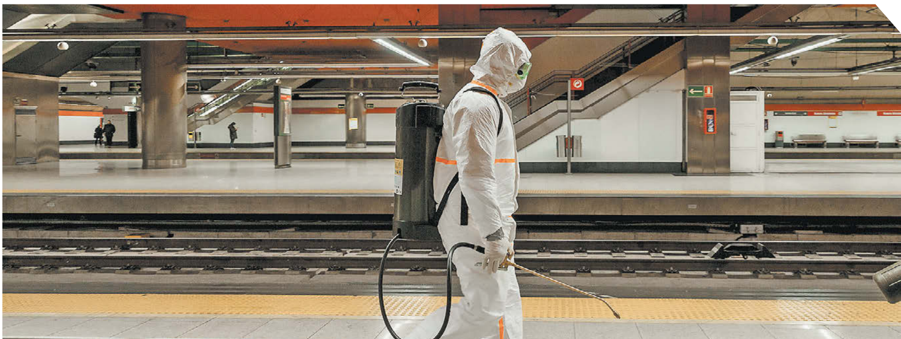
Дезинфекция одной из станций мадридского метро