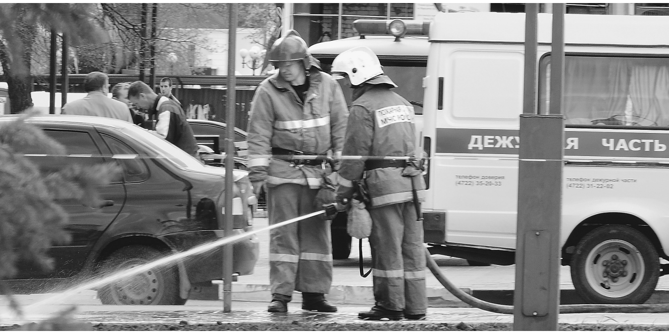
После сбора улик пришло время пожарных — смывать кровь с мостовой