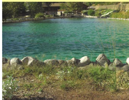
Какую рыбу лучше выращивать в прудовых хозяйствах?