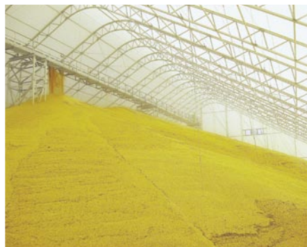
Страхование товарных запасов зерна