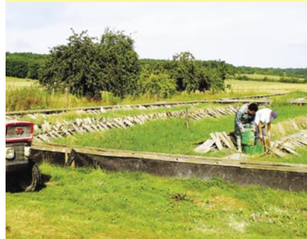
Развитие сельскохозяйственной кооперации в Европейском союзе