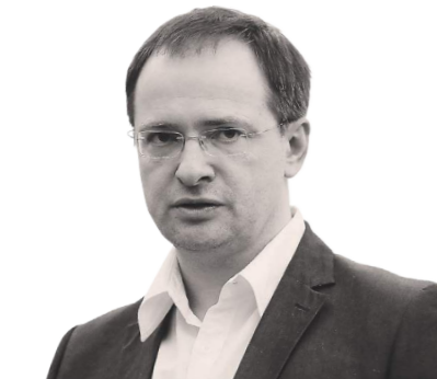
Владимир Мединский Министр культуры РФ

Что связывает людей, живущих в одной стране? Тем более стране самой большой по территории в мире, этнически и культурно разнородной? Что не дает всей этой сложной, уникальной и на первый взгляд противоречивой конструкции распасться? Ответ очевиден: чувство ответственности друг за друга, крепленное общим прошлым и готовностью построить совместное будущее.