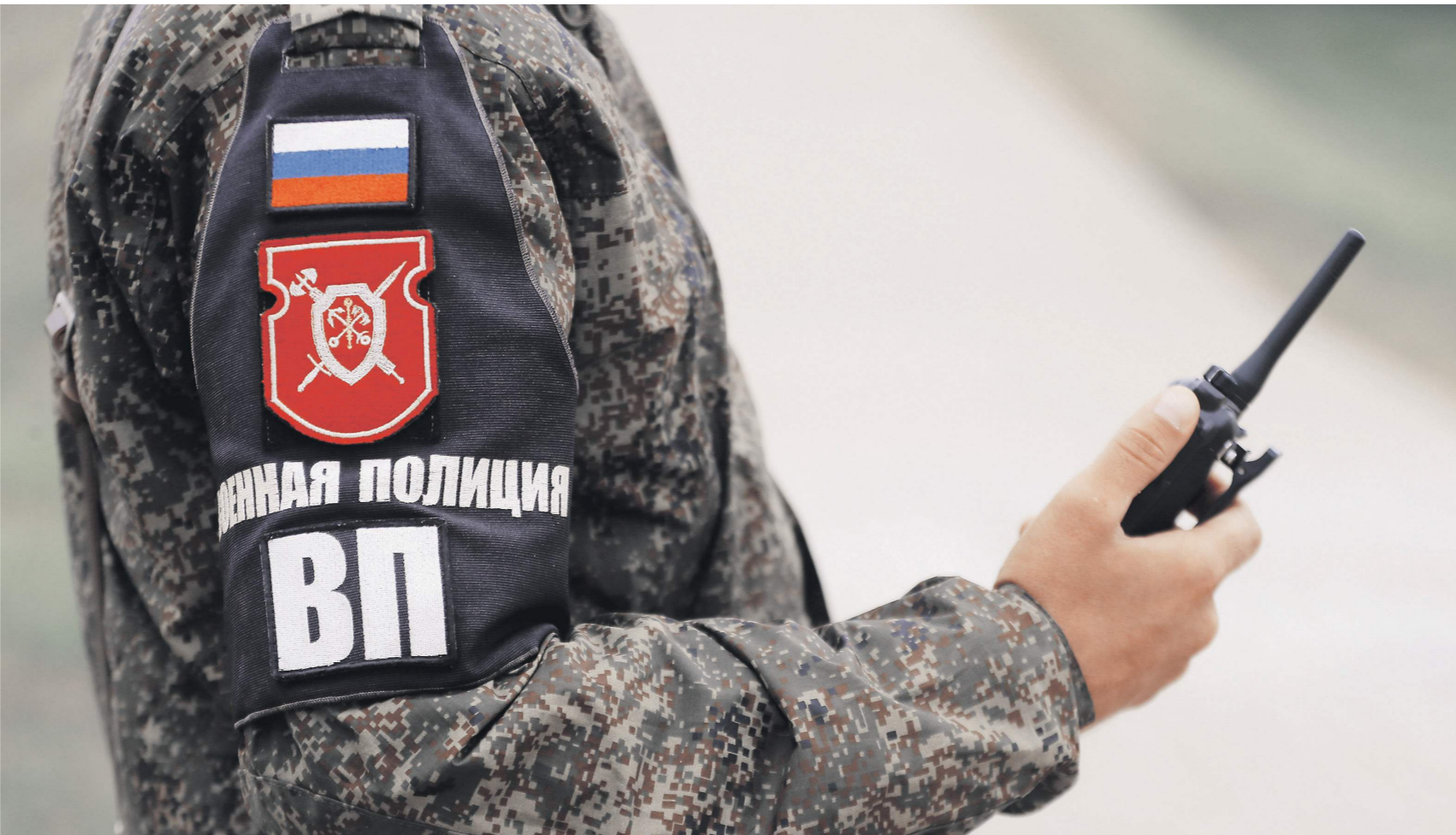
Новая программа защиты свидетелей должна повысить уровень раскрываемости резонансных преступлений

Под охрану военнослужащего будут брать в течение суток после принятия решения, а в случаях, не терпящих отлагательства, — немедленно. Для координации этой работы будет назначен куратор из числа сотрудников военной полиции. В Минобо-