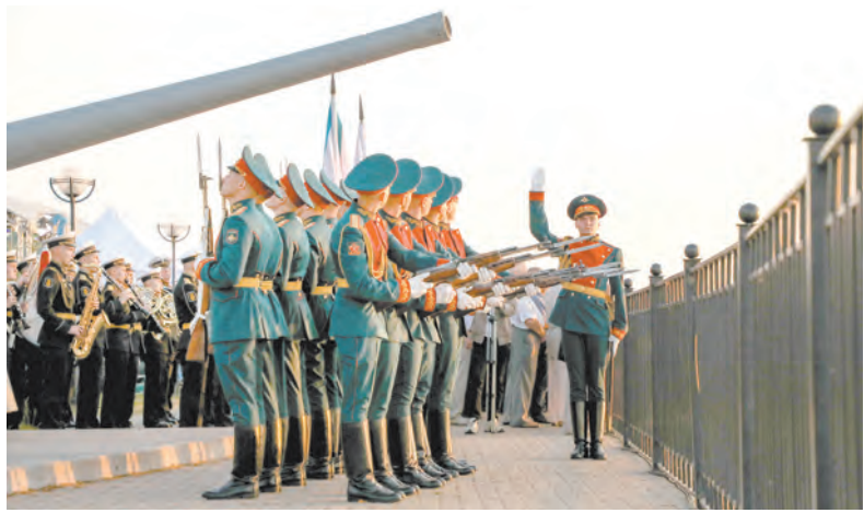
Торжественно-траурные мероприятия на «Дороге жизни»