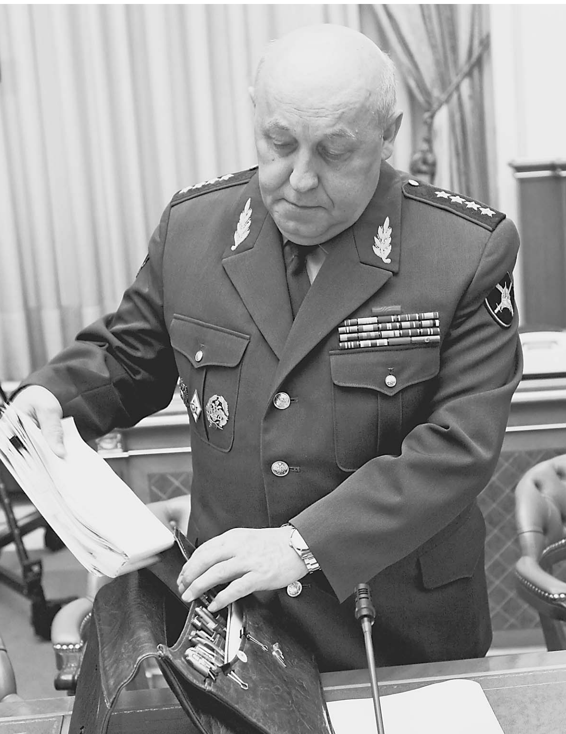
Начальник Генштаба ЮРИЙ БАЛУЕВСКИЙ оставил пост из-за разногласий с министром обороны Анатолием Сердюковым

Дмитрий Медведев назначил нового главу центра управления армией