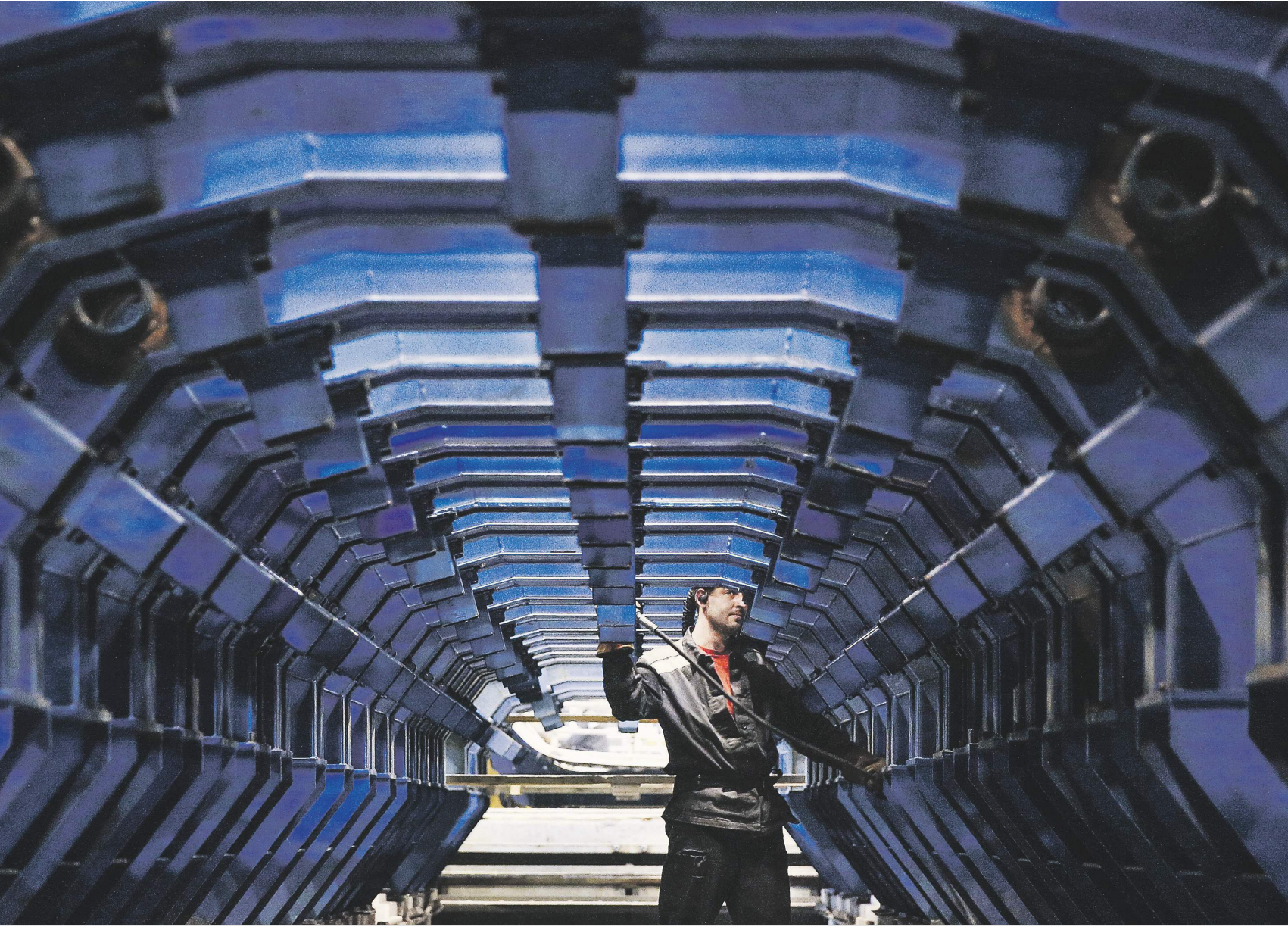
Дмитрий Коротаев / «Известия»