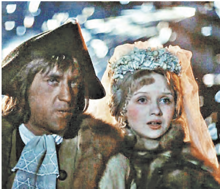
Наташу Ртищеву в «Сказе про то, как царь Петр арапа женил» Ирина Мазуркевич сыграла в 17 лет. Ее партнером был Владимир Высоцкий.

Официальные курсы валют ЦБ России и Нацбанка Беларуси