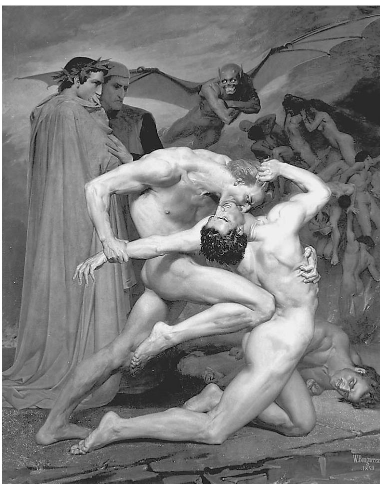
Адольф-Уильям Бугеро. ДАНТЕ И ВЕРГИЛИЙ В АДУ (1850)