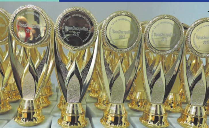
ПРОДЭКСТРАПАК-2017. КАТАЛОГ ПОБЕДИТЕЛЕЙ

ВНИМАНИЕ! Открыта подписка на электронную версию журнала. Подробнее на www.magpack.ru