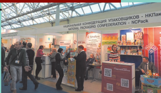
ВЫСТАВКА УПАКОВКА 2017 ОТКРЫЛА ГОД