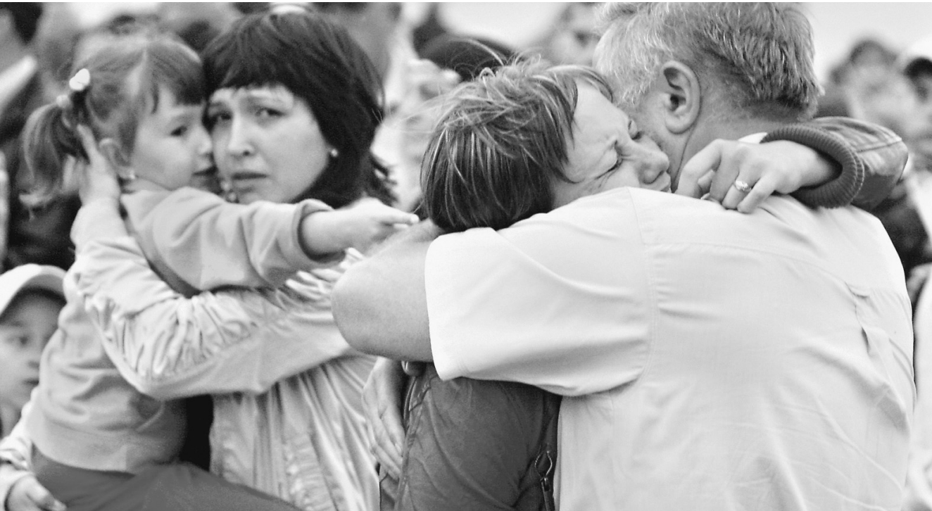
Выжить в страшном кораблекрушении удалось меньше чем половине находившихся на борту пассажиров

У теплохода, отремонтированного с использованием некондиционных деталей, не было лицензии на пассажирские перевозки