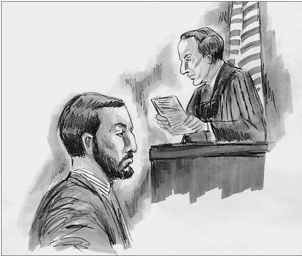
Апрель 2002 года. Арнаут дает показания в суде

● ЦИТАТА ДНЯ «Благотворительность и патриотизм — главные качества американца, которому нужно что-либо продать».