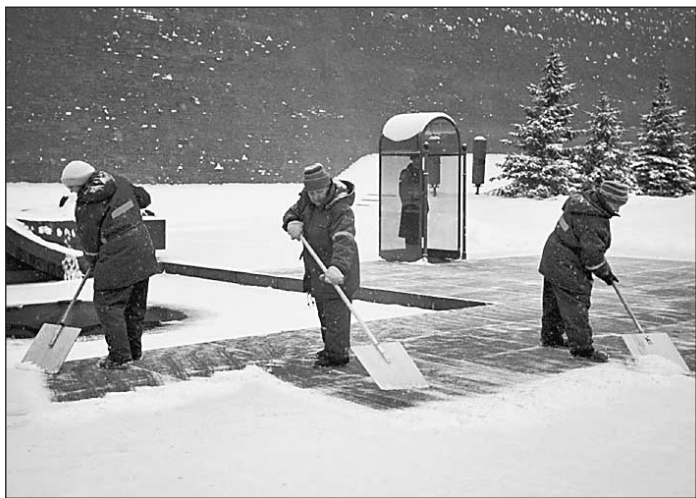
У Кремлевской стены снег пока еще чистят

«Другие организации», как утверждали в суде представители прокуратуры Северного округа