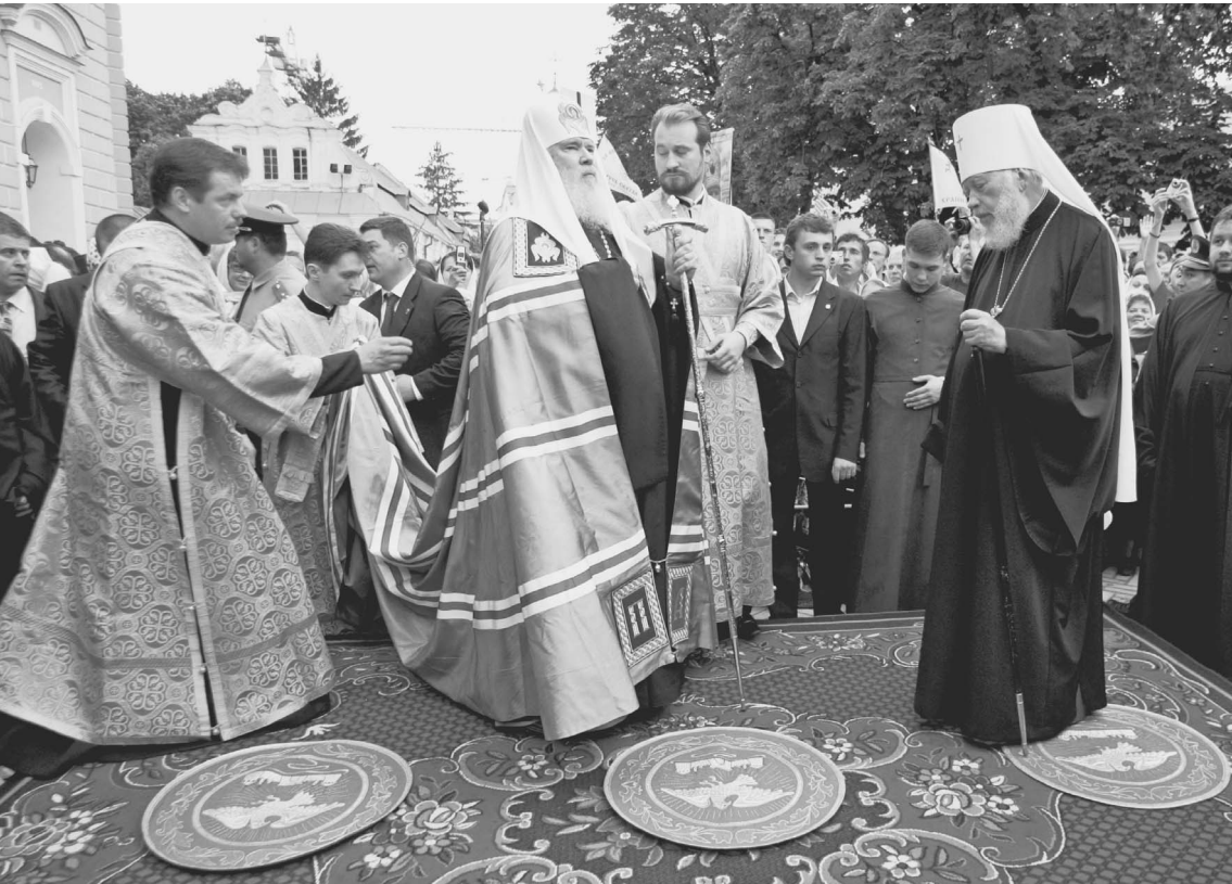
ПАТРИАРХ АЛЕКСИЙ II: «Посещение Киева воспринимаю как милость Божию»

Патриарха Московского и всея Руси Алексия II, прилетевшего в субботу вечером в Киев для участия в торжествах по случаю 1020-летия Крещения Руси, на улицах города встречали тысячи человек. И это при том, что информация о его визите фактически была сведена к минимуму — украинские власти демонстрировали подчеркнутое безразличие к приезду Предстоятеля Русской православной церкви. → стр. 2