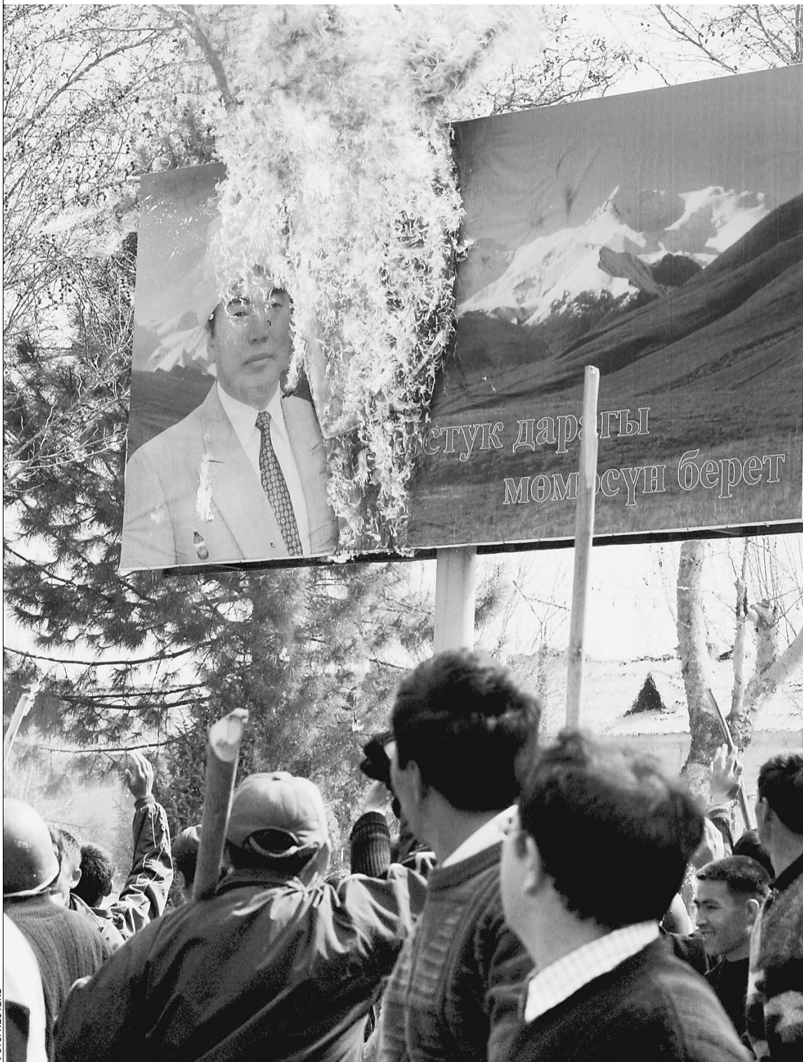
«Тюльпановая революция» в Киргизии развивается отнюдь не мирным путем

Как и предсказывали «Известия», следующей после Грузии и Украины страной СНГ, где оппозиция попытается силой захватить власть, становится Киргизия. В республике уже идут уличные бои. Таким образом, с самого начала среднеазиатская «революция» обозначила свое отличие от европейских — «бархатных», мирных, бескровных. Но и параллелей с тем, что произошло в Тбилиси и Киеве, немало. Во-первых, поводом для выступлений стали обвинения властей в фальсификации результатов выборов. Во-вторых, во всех трех случаях оппозиция апеллирует к Западу, рассчитывает на его поддержку. Наконец, в-третьих, в конфликт опять оказывается вовлеченной Россия. И вновь — на стороне властей. Одна из лидеров киргизской оппозиции — Роза Отунбаева даже заявила, что, по ее данным, президент Аскар Акаев срочно вылетел в Москву — просить о помощи.