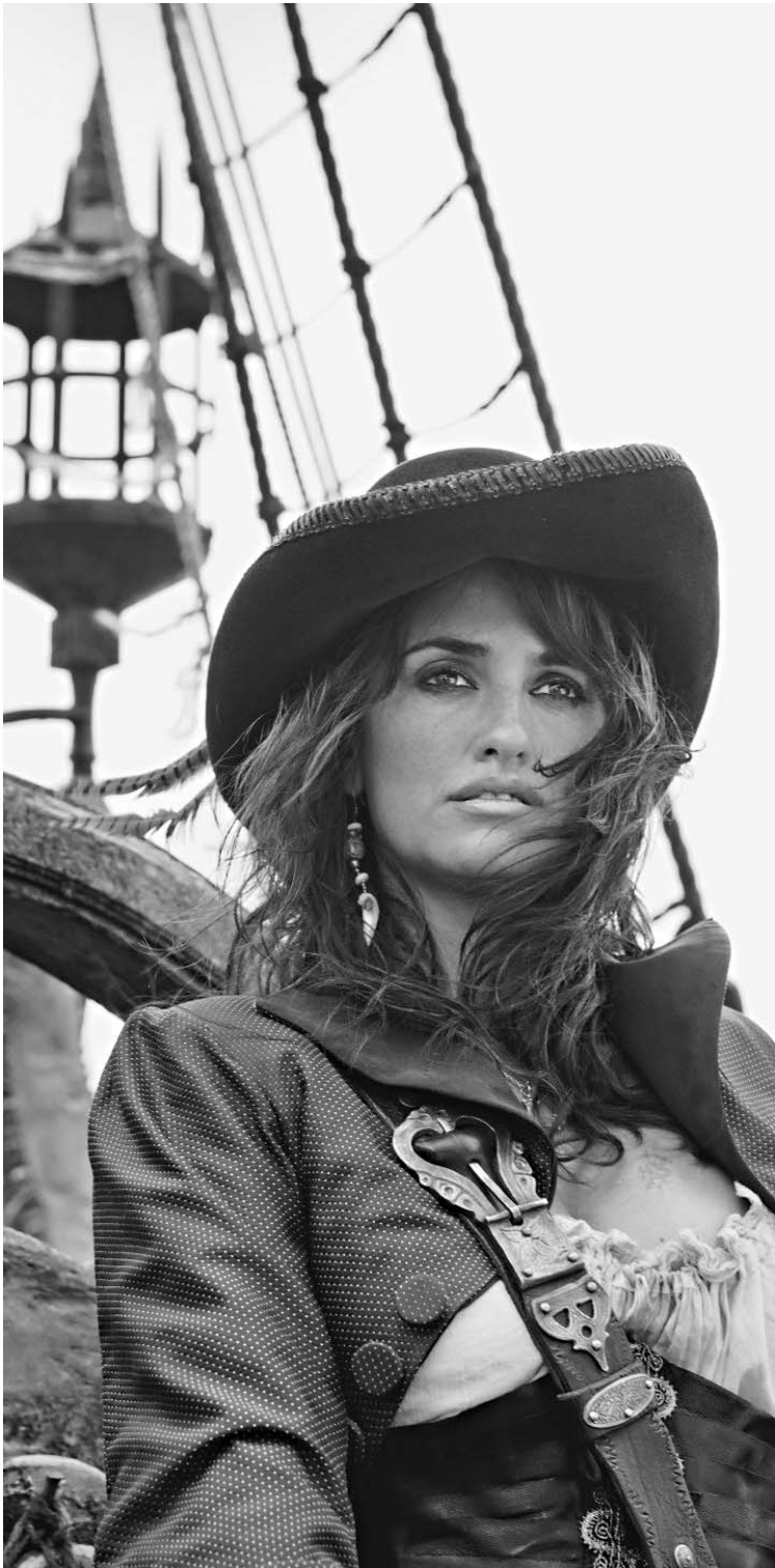
Пенелопа Крус в «Пиратах Карибского моря-4» — фильм-лидере российского проката

«Известия» подводят предварительные итоги кинопроката первого полугодия 2011-го. Поскольку у нас так и не прижилось понятие «летний блокбастер», то, значит, с середины июня до конца августа будет продолжаться «мертвый сезон» →07