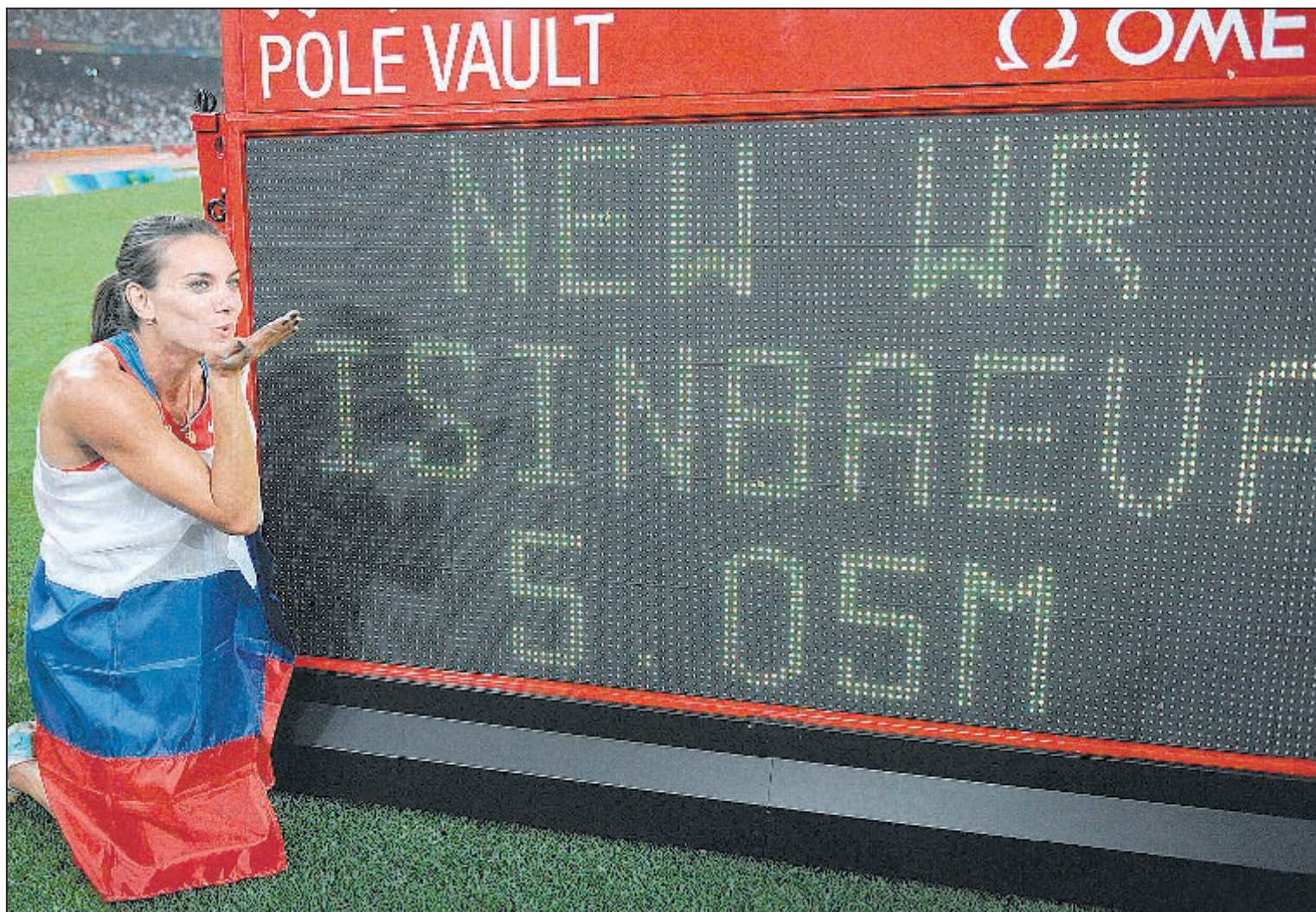
18 августа 2008 года. Пекин. Только что Елена ИСИНБАЕВА установила новый мировой рекорд.

Вчера Елена Исинбаева, двукратная олимпийская чемпионка по прыжкам с шестом и одна из самых ярких фигур в истории современного российского спорта, официально объявила о завершении карьеры. На пресс-конференции в Рио-де-Жанейро 34-летняя легкоатлетка, не допущенная до соревнований вместе со всей нашей командой, рассказала о своем будущем в качестве спортивного функционера и послала миллионам поклонников воздушный поцелуй.