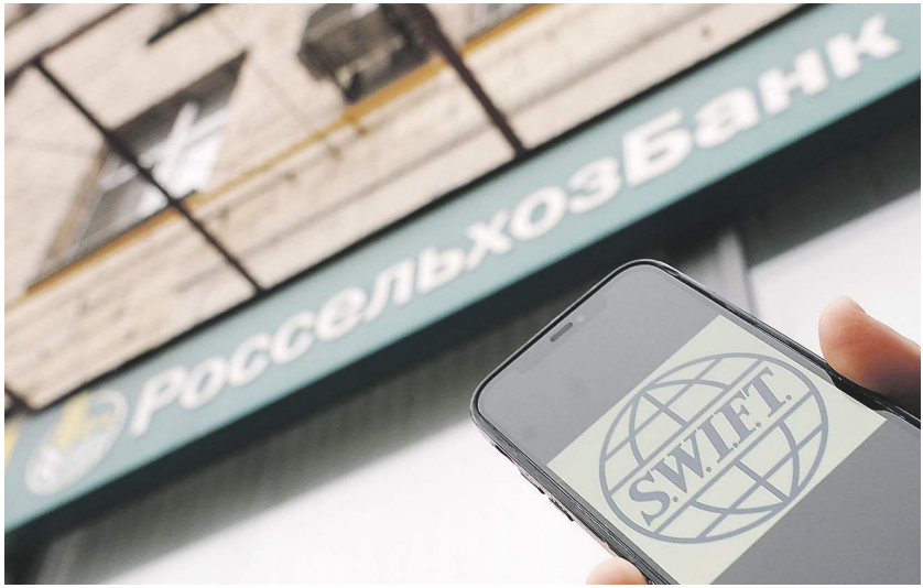
Павел Волков | «Известия»

ли: сделки в сфере сельского хозяйства и продовольствия проходят через банки третьих стран, в частности Турции. Но в последнее время эти банки опасаются санкций, что сильно затруднило транзакции для российских аграриев. Евросоюз ввёл санкции и отключил Россельхозбанк (РСХБ) от финансовой системы SWIFT в начале июня в рамках шестого пакета ограничений. В интервью «Известиям» в середине ноября замглавы МИД РФ Сергей Вершинин заявил, что Москва будет требовать исключения РСХБ из санкционных списков, поскольку это главный российский банк по финансированию аграрных сделок. 04 →