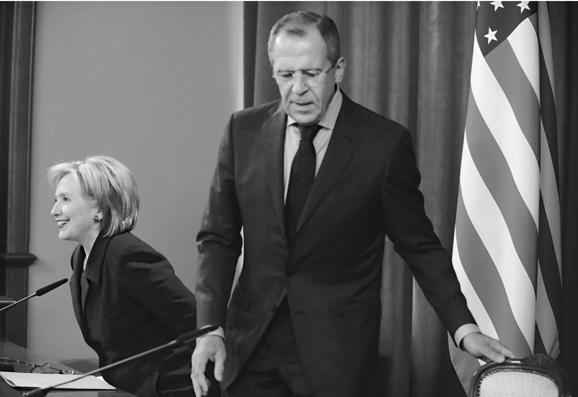
Госсекретарь США Хиллари Клинтон и глава МИД России Сергей Лавров весь год занимались «перезагрузкой» двусторонних отношений. До подлинного партнерства Москве и Вашингтону пока далеко