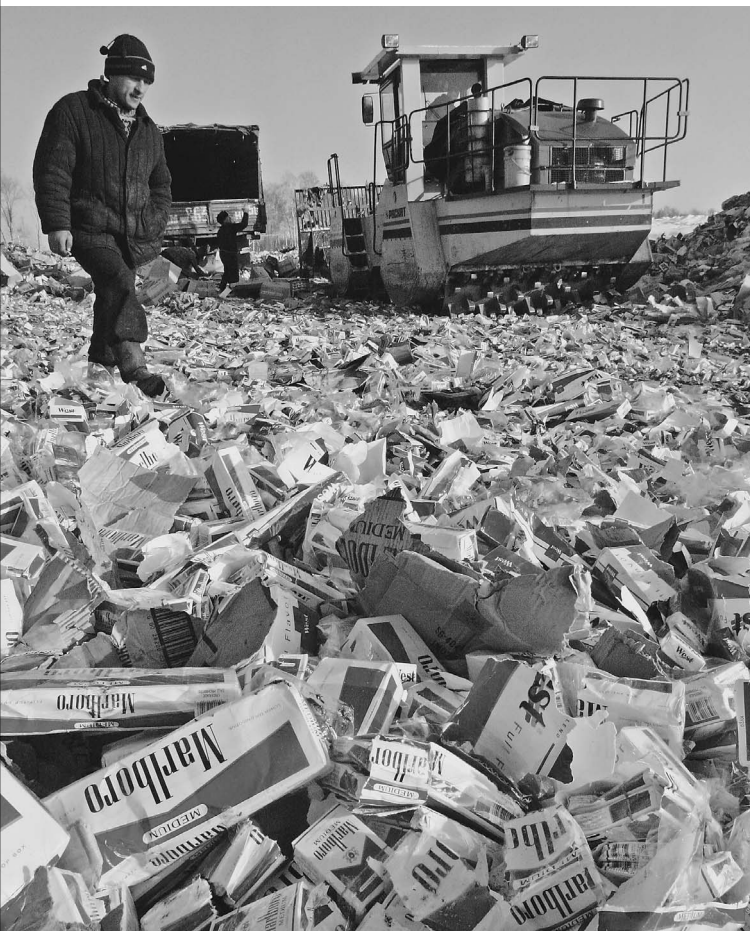
Зачастую российским курильщикам подсовывают контрафакт (на фото уничтожают крупную партию «левых» сигарет)