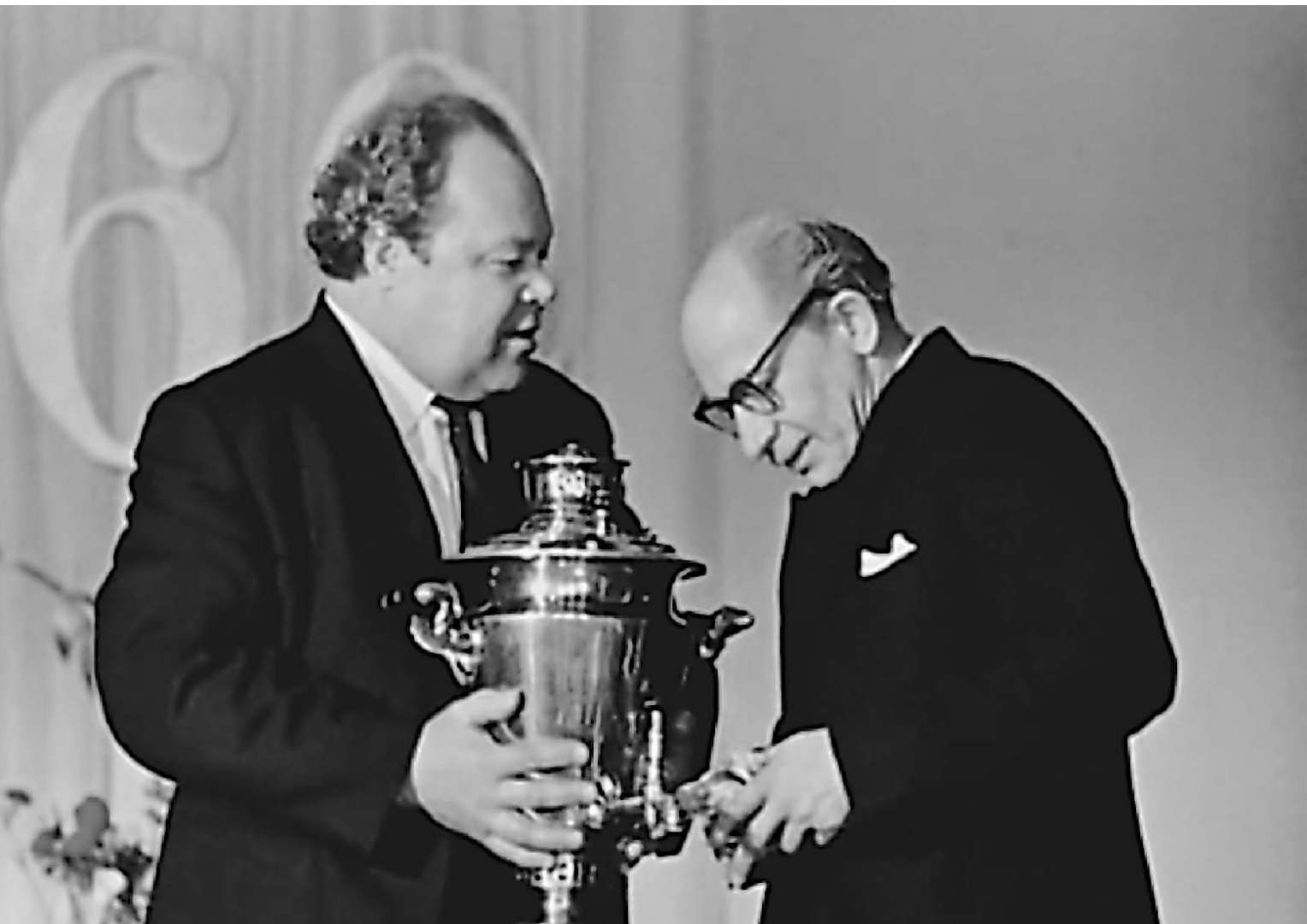
Герой всеми любимой комедии Валентин Петрович Воробьев так расчувствовался, что передумал уходить на пенсию. Будущие российские пенсионеры пойдут на заслуженный отдых с большей охотой