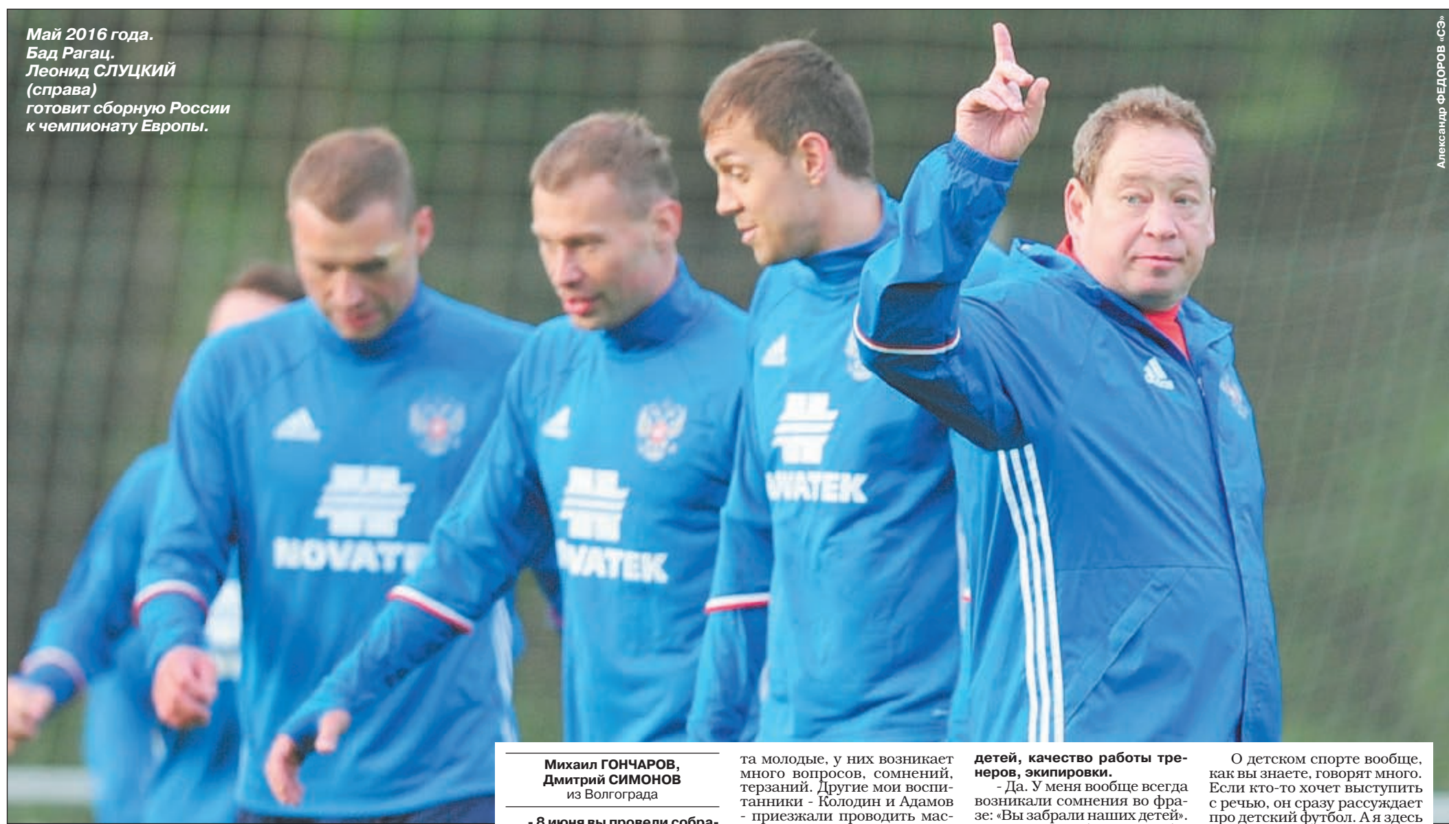
Александр ФЕДОРОВ «СЭ»

Май 2016 года. Бад Рага. Леонид СЛУЦКИЙ (справа) готовит сборную России к чемпионату Европы.