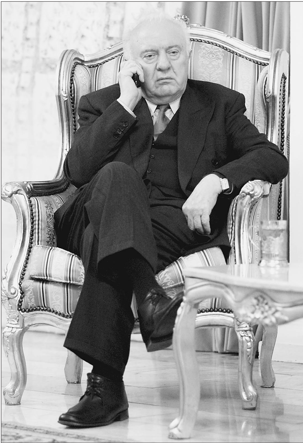
23 ноября в 19.51 по московскому времени Эдуард Шеварднадзе объявил об отставке

Еще одна потенциальная «горячая точка» — Джавахетия, где компактно живут армяне. Их отношения с центральными властями — весьма напряженные, но Шеварднадзе удавалось находить с ними общий язык и заглушать сепаратистские настроения. Националистические лозунги грузинских радикалов пугают армян. В ходе избирательной кампании и сразу после выборов Саакашвили допустил несколько выпадов в адрес национальных меньшинств. Например, обвинил армян и азербайджанцев в том, что «только они поддерживают коррумпированного президента, от которого стонет народ Грузии». В Джавахетии (в Ахалкалаки) расположена российская военная база. И служат там главным образом местные жители — почти поголовно армяне. Маловероятно, что в случае столкновений с при-