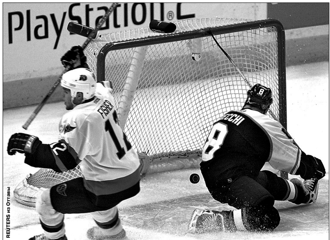
Понедельник. «Оттава» - «Филадельфия» - 3:0.

Вчера в НХЛ состоялось несколько громких сенсаций. «Посеянная» седьмой в Восточной конференции «Оттава» разгромила «Филадельфию» (номер два) - 3:0 и вышла вперед в серии - 2-1. Другой сюрприз преподнес на «Западе» «Лос-Анджелес» (7), одолевший «Колорадо» (2) - 3:1. Правда, в этой серии пока впереди фаворит - 2-1. И лишь в противостоянии «Сан-Хосе» (3) и «Финикса» (6) вчера победил старший по рангу - 4:1 (счет в серии - 2-1).