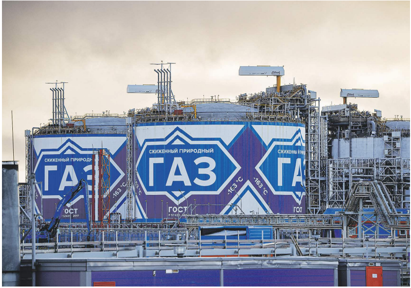
Владимир Писев / РИА Новости

Как сообщили «Известиям» в «Автостате», по состоянию на начало 2022 года в России было зарегистрировано 11,7 тыс. автобусов на метане (2,8% от их общего количества).