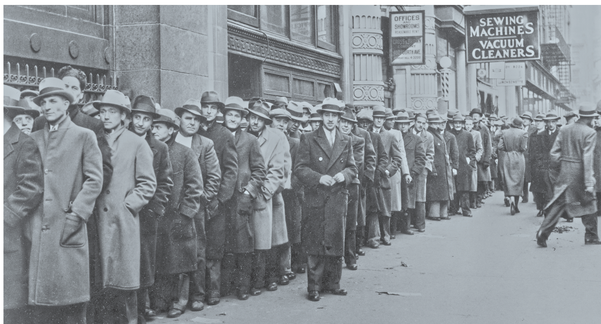
Число заявок на пособия по безработице, поданных американцами за 3 недели, уже побilo рекорды Великой депрессии. americanpolitics.com

Всемирная торговая организация (ВТО) прогнозирует спад в мировой торговле в 2020 году от 13 до 32% на фоне пандемии коронавируса. Столь значительный диапазон в прогнозах эксперты объясняют «беспрецедентным характером нынешнего кризиса в здравоохранении и неопределенностью относительно его точных экономических последствий».