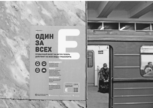
Программа лояльности прибавит пассажиров в вагоны

Московский метрополитен работает программу лояльности для постоянных пассажиров. Об этом «Известиям» сообщили в пресс-службе метрополитена. Сейчас на официальном сайте подземки проводится опрос, в ходе которого москвичи могут выбрать систему поощрения. Рассматривается идея предоставлять постоянным клиентам в подарок бытовую технику, безлимитные карты на месяц, а также билеты на поездку дальнего следования и самолеты. — Программа лояльности будет введена для того, чтобы улучшить взаимодействие метрополитена с пассажирами, — пояснили в пресс-службе предприятия. По информации пресс-службы, формировать систему поощрения поможет опрос «Метрополитен глазами пассажиров». В частности, с его помощью москвичи могут оценить варианты бонусов. Предлагается выдавать постоянным клиентам метро подарочные сувениры с логотипом метрополитена, приглаственные билеты на торжественные мероприятия, безлимитный билет на метро в течение месяца, 10 биле-