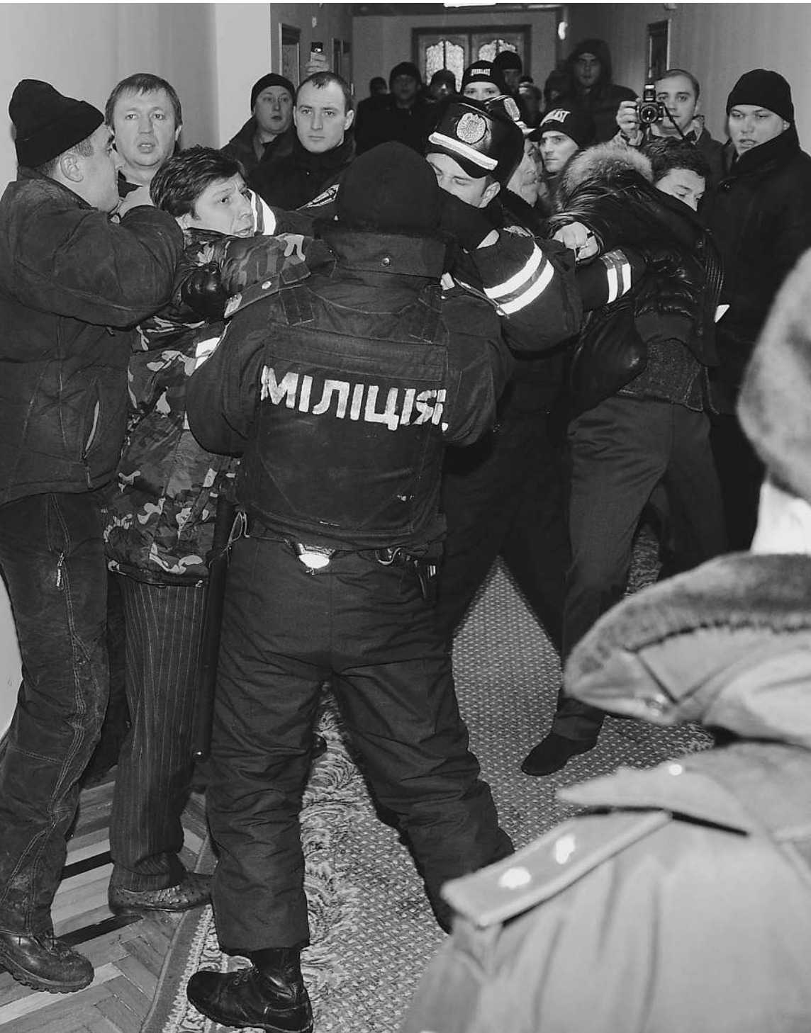
Вместо того чтобы защищать охранников комбината и депутатов Верховной рады, милиция их избивала

Первый штурм будущей революции уже состоялся