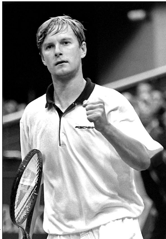
В начале второго сета Хенмэн решил вернуться к своей коронной тактике, стал чаще атаковать, и это дало свои плоды. В четвертом гейме он взял подачу Кафельникова, ушел вперед - 3:1, россиянин тут же сократил разрыв - 3:2, но британец снова оторвался - 4:2, после чего в седьмом гейме на своей подаче не отдал ни одного очка - 5:2. И все-таки сравнять счет по партиям Хенмэн

Кафельников и Хенмэн хорошо знают друг друга. Впервые эти два игрока встретились именно в Роттердаме три года назад - тогда в полуфинале в двух сетах сильнее оказался россиянин. В последний же раз они вместе выходили на корт в ноябре прошлого года, в четвертьфинале Открытого чемпионата Парижа. Кафельников тоже победил, доведя счет в личных встречах до 6:3. Хенмэн прекрасно представлял, что соперник готов к его традиционной манере: подача - выход к сетке, поэтому уже при розыгрыше первого очка решил остаться на задней линии. Эксперимент оказался неудачным, англичанин уступил после обмена 14 ударами. И все-таки прежде всего благодаря хорошей подаче (в первом и третьем геймах он сделал в сумме четыре эйса) Хенмэн до некоторых пор удавалось сохранять равновесие. Правда, длилось это недолго: при счете 2:2 Кафельников взял чужую подачу в первый раз, а в седьмом гейме сделал еще один брейк.