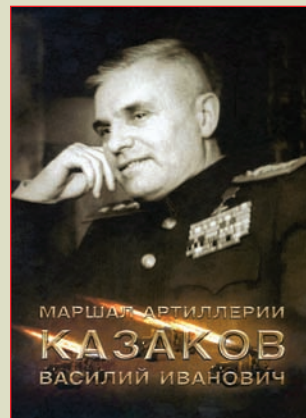
▲ Обложка книги