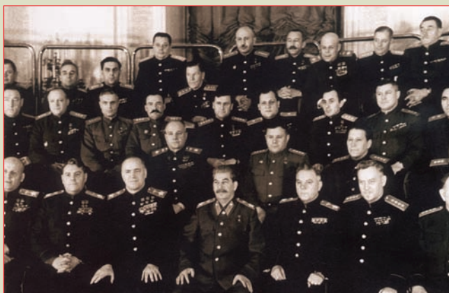
◀ Полководцы и военачальники Великой Отечественной войны на 1-й сессии Верховного Совета СССР второго созыва. В.И. Казаков третий слева в третьем ряду Москва, Кремль, март 1946 г.