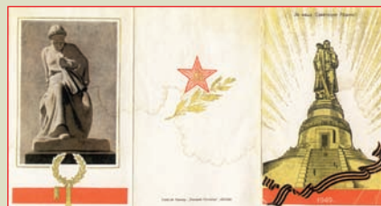
Билет на открытие памятника советским воинам в Берлине 8 мая 1949 г.