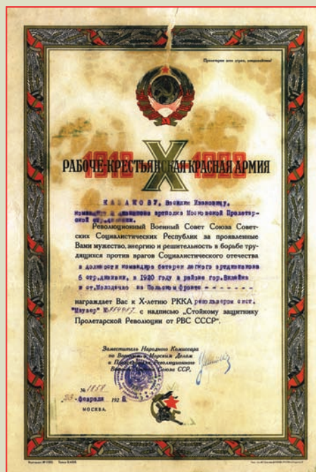
▲ Наградной лист к револьверу системы «Маузер» Москва, 23 февраля 1928 г.