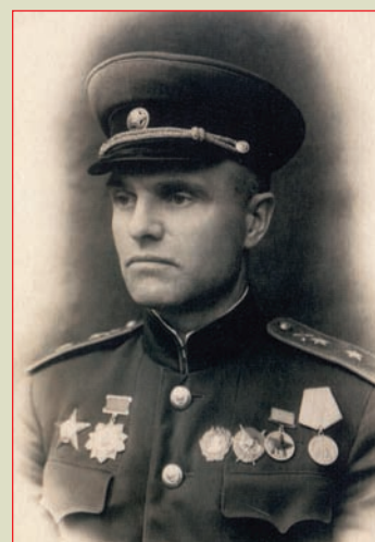
▲ Генерал-лейтенант артиллерии В.И. Казаков Лето, 1943 г.