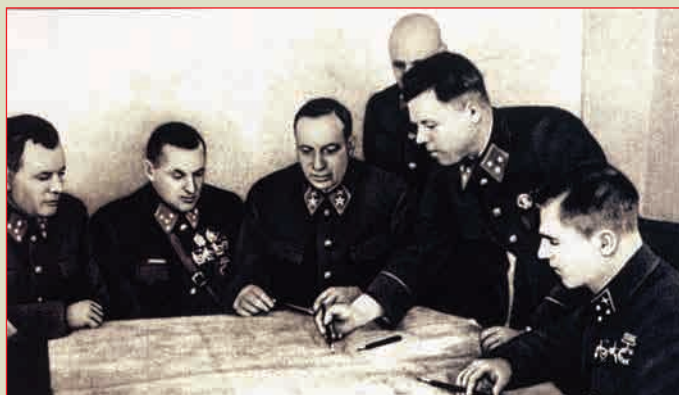
▲ Сталинградская битва. В штабе Донского фронта (слева направо): А.А. Новиков, К.К. Рокоссовский, Н.Н. Воронов, К.Ф. Телегин, М.С. Малинин, В.И. Казаков Осень, 1942 г.