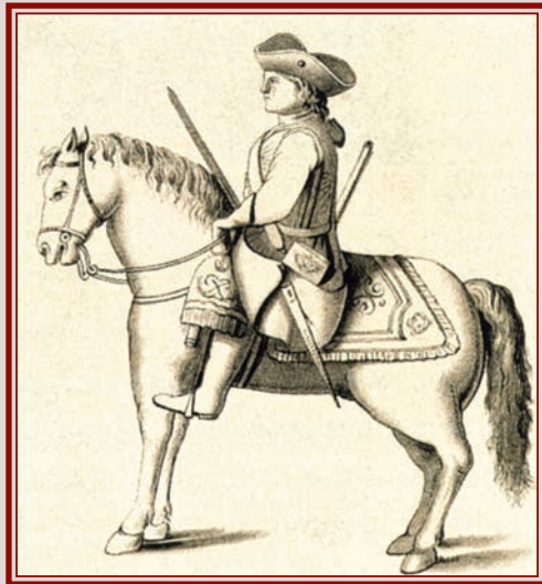
▲ Конный кавалергард 1727 г.

Развод гвардейского караула ▲ у Летнего дворца императрицы Елизаветы Алексеевны 1750-е гг.