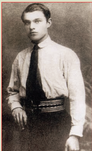
▲ Василий Казаков Петроград, 1916 г.

К 110-летию со дня рождения маршала артиллерии В.И. Казакова