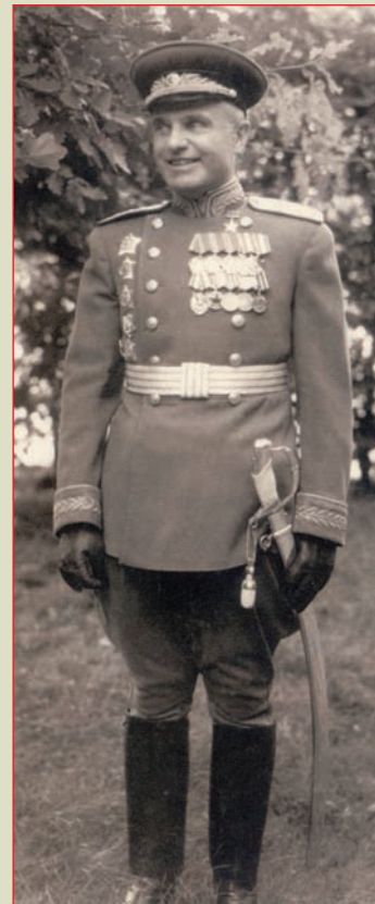
► Перед Парадом Победы 24 июня 1945 г.