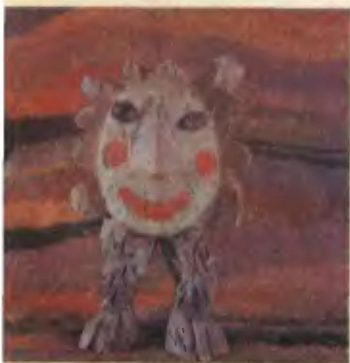
На первой странице обложки — деревянная скульптура современно- го российского художника С. Горшкова из серии «Монстры». Стиль работ Сер- гея — пародия на китч.

Традиционно свой второй номер редакция журнала посвящает истории России. Этот номер посвящен смеху на Руси.