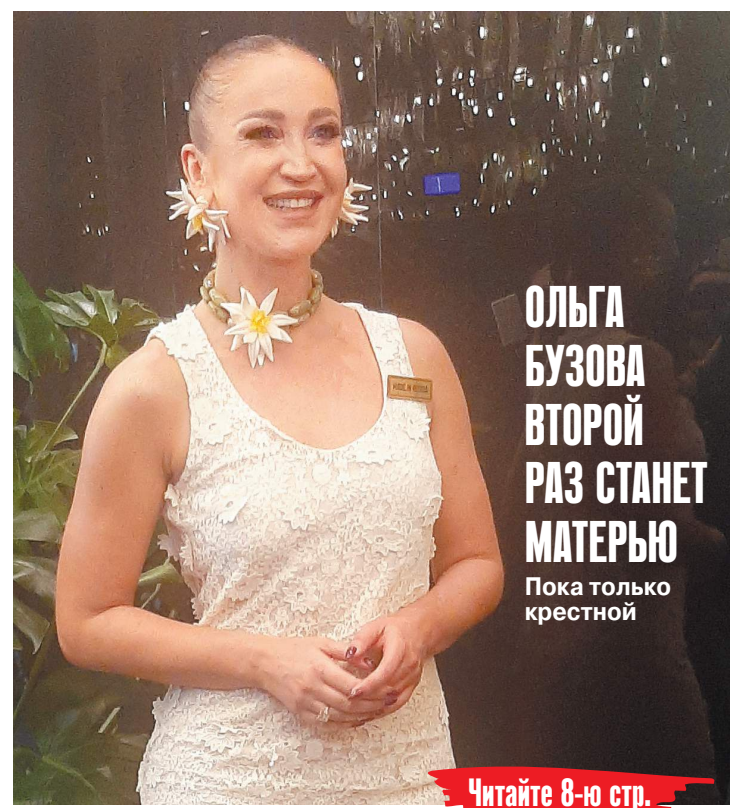
ОЛЬГА БУЗОВА ВТОРОЙ РАЗ СТАНЕТ МАТЕРЬЮ Пока только крестной