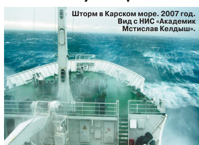
Шторм в Карском море. 2007 год. Вид с НИС «Академик Мстислав Келдыш».