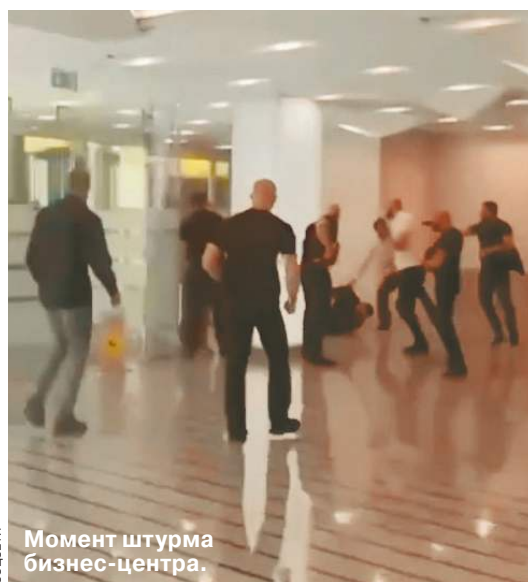
Момент штурма бизнес-центра.