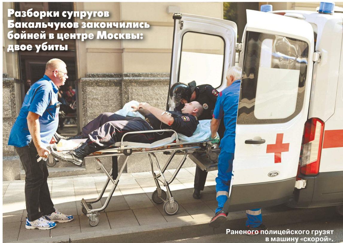
Раненого полицейского грузят в машину «скорой».

Разборки супругов Бакальчуков закончились бойней в центре Москвы: двое убиты