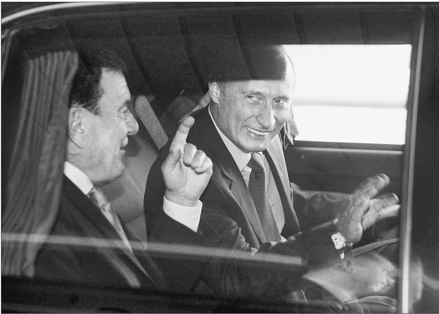
9 октября. Екатеринбург. Владимир Путин и Герхард Шредер на пути к новому европейскому партнерству

Немецкая сторона ожидала, что в Екатеринбурге будет подписан меморандум между «Газпромом» и «Рургазом» о строительстве Северо-Европейского газопровода. Инвестиции в проект оцениваются почти в 6 млрд евро, но пока не ясно, кто будет вкладывать деньги и будет ли вообще. Главы