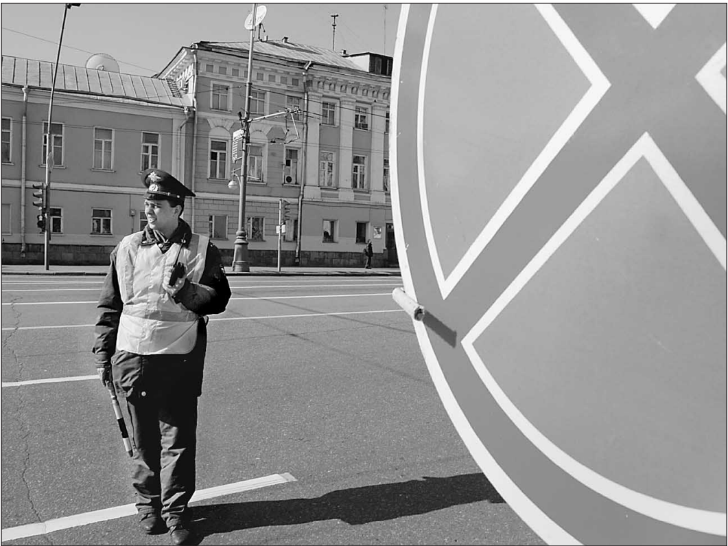
Поводов для общения с сотрудниками ГИБДД у автомобилистов станет больше

— Запрет грузовикам, выражаясь на бытовом уровне, «типа «Газели» передвигаться в левом