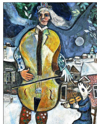
М.З. Шагал. Виолончелист. 1939. Холст, масло, 101×74 см. Частная коллекция