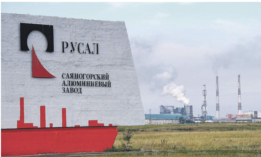
В «Русале» ждут снятия американских санкций

Анонсированные США послабления для «Русала» вряд ли станут трендом в отношении российского бизнеса