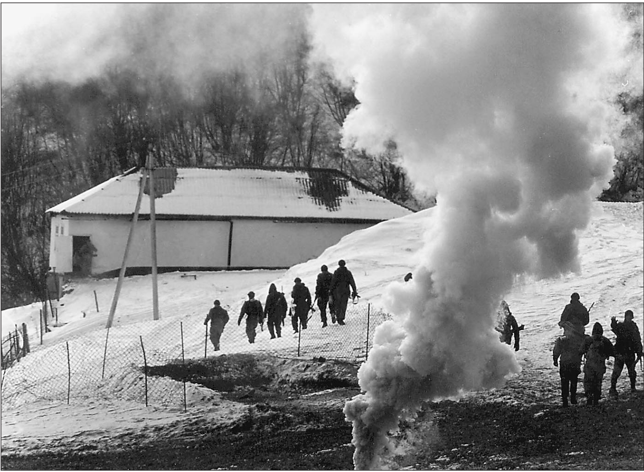
1999 год. Дагестан. Так начиналась вторая чеченская война