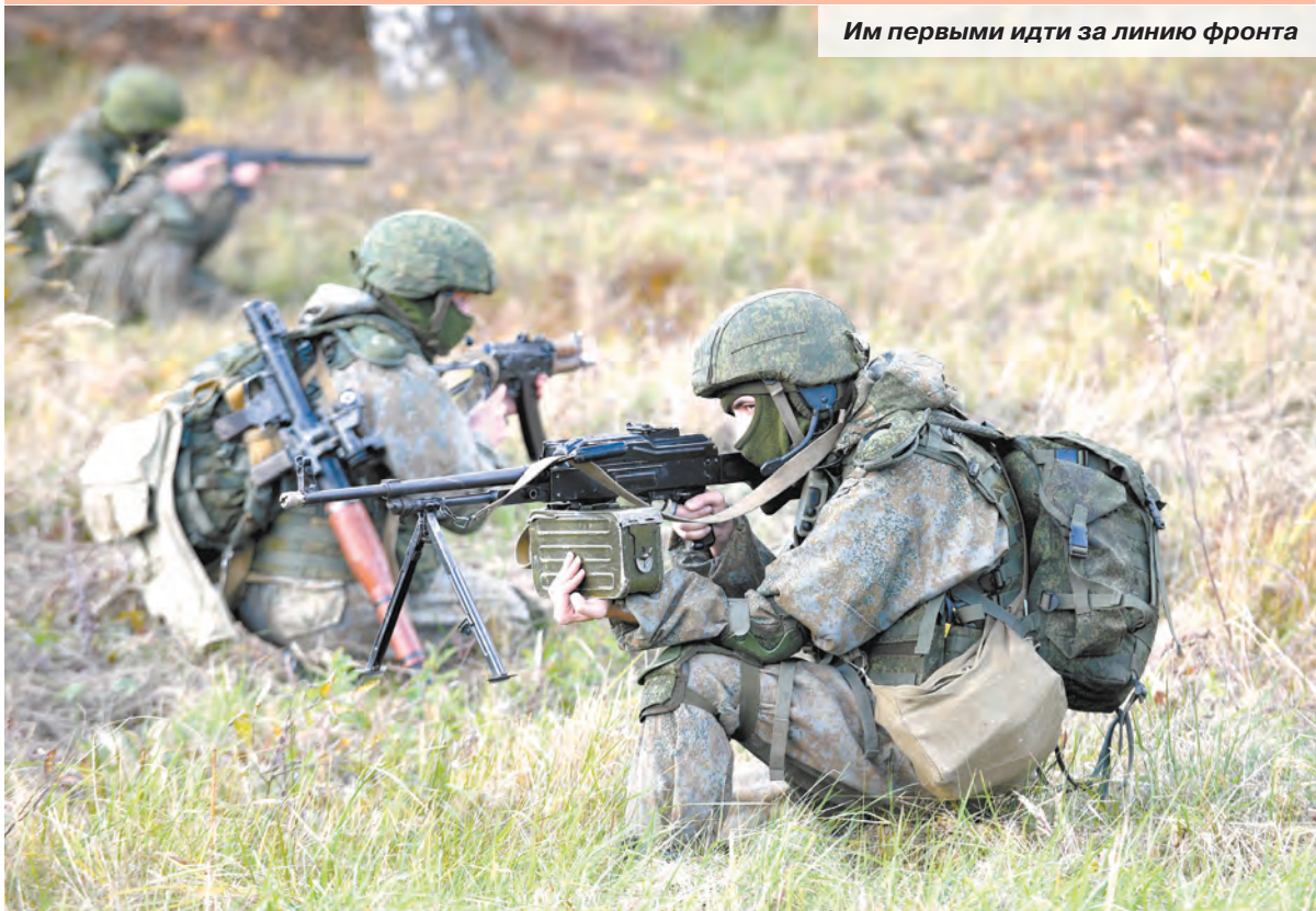
Им первыми идти за линию фронта