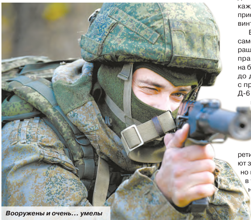
Вооружены и очень... умелы