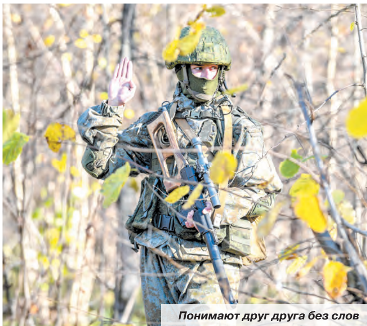
Понимают друг друга без слов