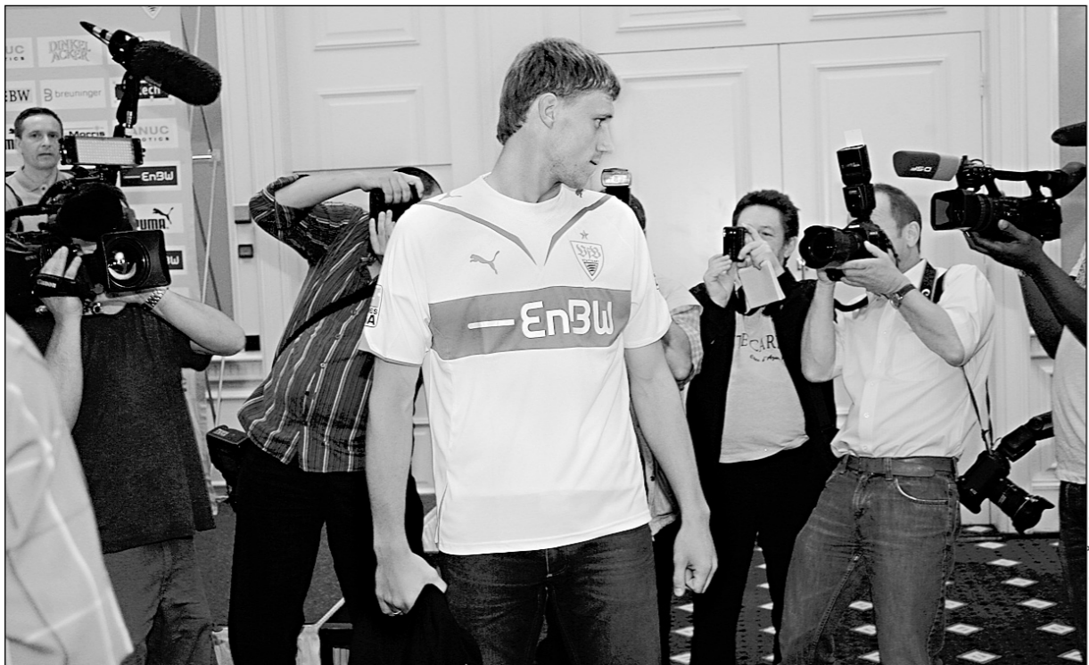
Вчера. Штутгарт. Пресс-конференция Павла ПОГРЕБНЯКА.