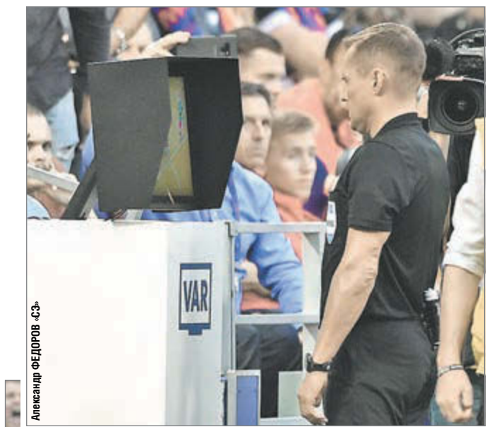
Александр ФЕДОРОВ «СЭ»

Вчера вечером в главном матче тура ЦСКА - «Локомотив» состоялось историческое событие: армейский клуб одержал победу (1:0) благодаря действиям видеоарбитров.