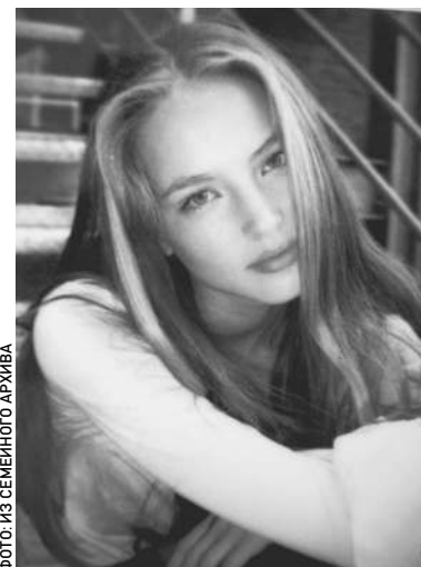
Руслана Коршунова входила в знаменитую «Русскую тройку» фотомоделей

Теперь Русланы нет. Она погибла в Нью-Йорке. Похоронили ее в Москве. А в Алма-Ате к плакату с яблоком до сих пор несут живые цветы. Для города яблок и красоты она стала второй принцессой Дианой. → стр. 8