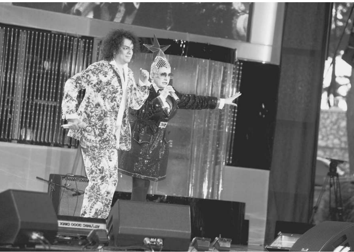
Филипп Киркоров и Андрей Данилко идеально вписались в концепцию «новорусского шоу» в Юрмале

Безупречно загоревшие вдали от родины медийные российские персоны, восторженные, словно дети на шоколадной фабрике. Молодые, безвестные пока поп-исполнители, рассчитывающие на «счастливый билет» и последующую матпомощь вышеупомянутых лиц, подлинники свежих престижных трофеев наших хоккеистов и футболистов, пущенные в жеребьевочное дело. И, конечно, «муза» Алла Борисовна Пугачева, аки Ассоль стоящая на балтийском берегу и встречающая дорогих гостей, со стороны моря направляющихся по ковровой дорожке к залу «Дзинтари». Так выглядел старт VII Международного конкурса «Новая волна-2008» в Юрмале, который на латвийских телеканалах позиционируют как «шоу в русском стиле». → стр. 10