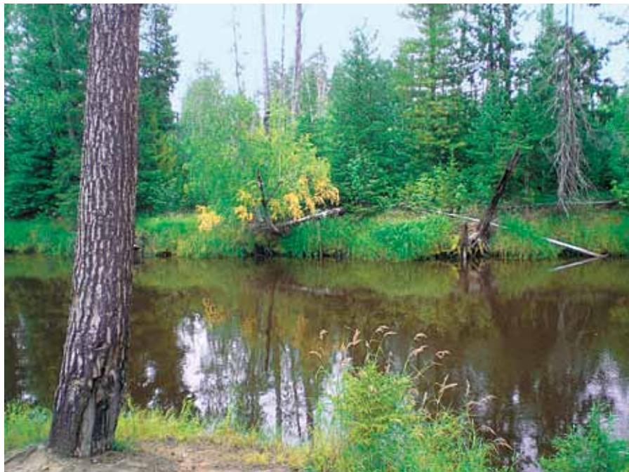
Очень красива какая-нибудь лесная речка...