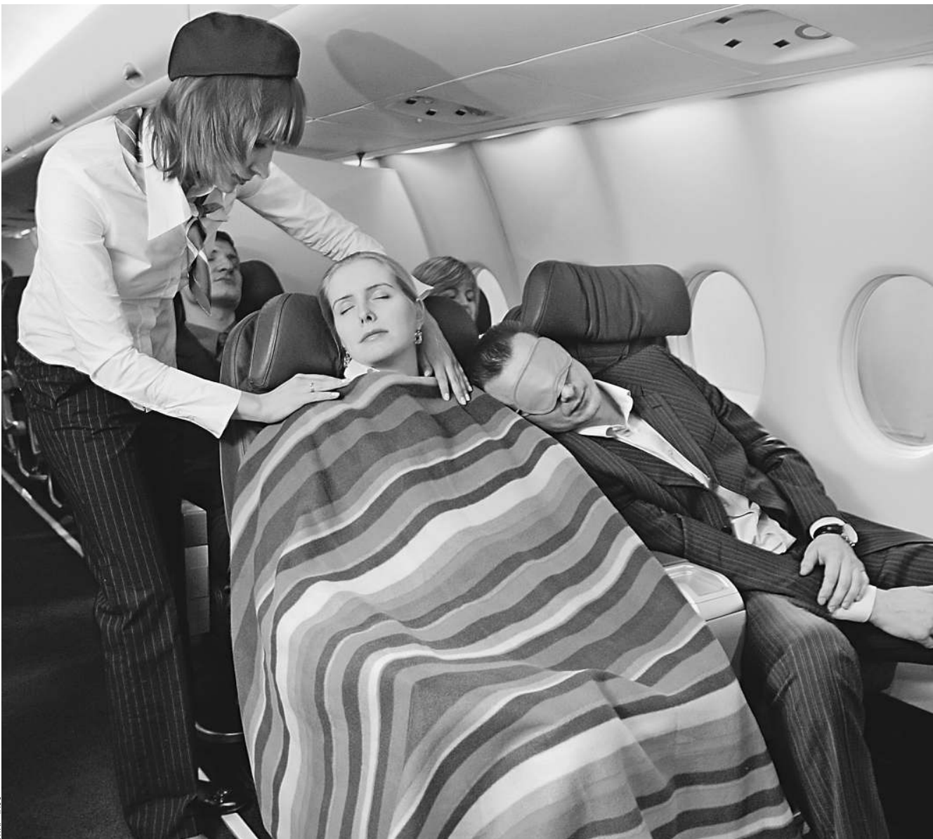
Роспотребнадзор потребовал от сотрудников авиакомпаний докладывать в надзорные службы о людях — носителях опасной инфекции