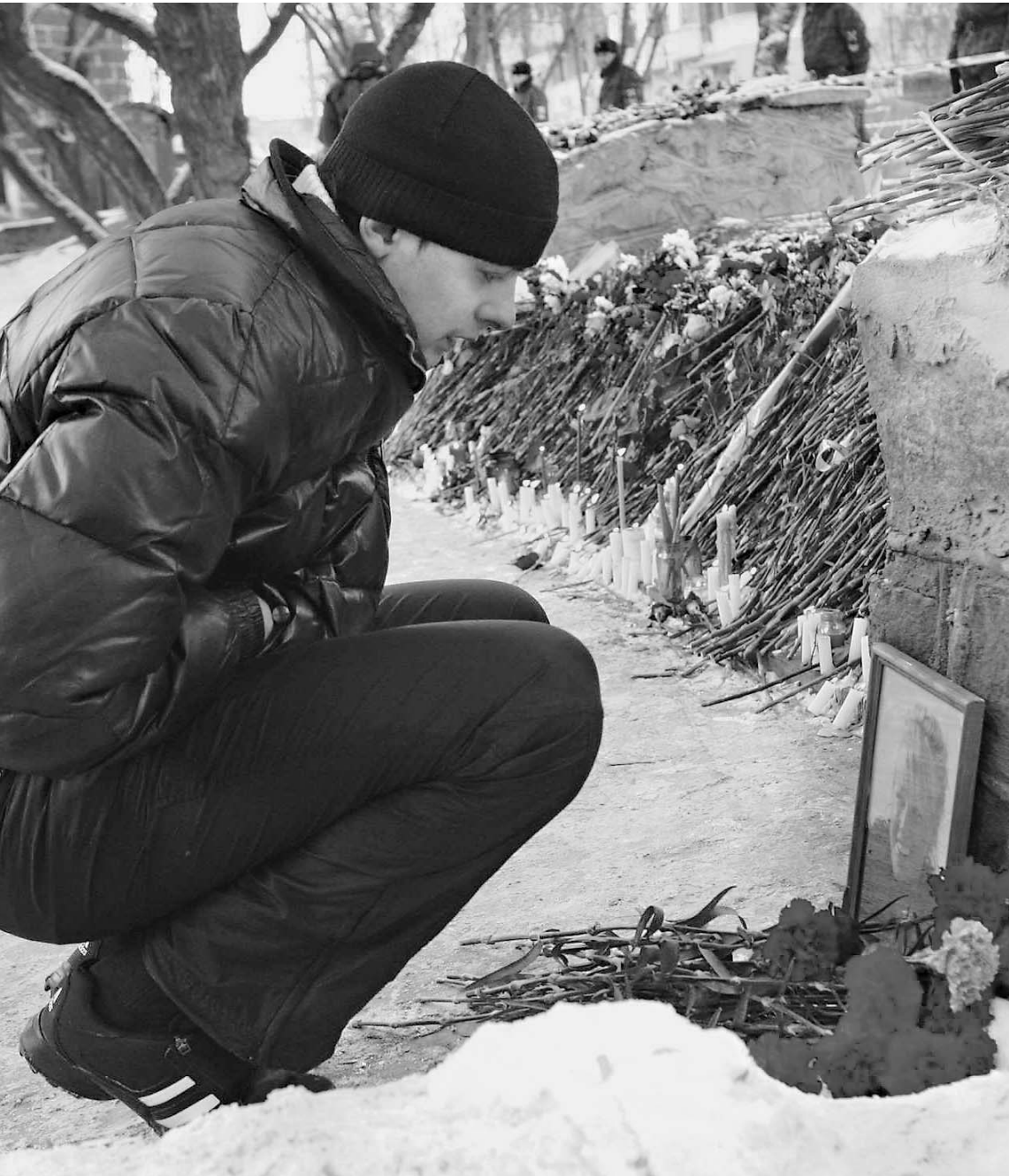
6 декабря. Жители Перми несут цветы к стенам клуба «Хромая лошадь»

Сегодня в России день траура по погибшим в Перми