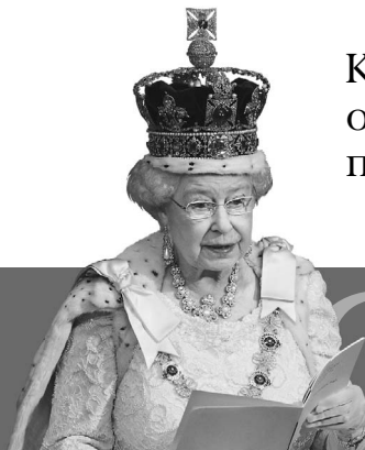
Королева объявила войну папарацци