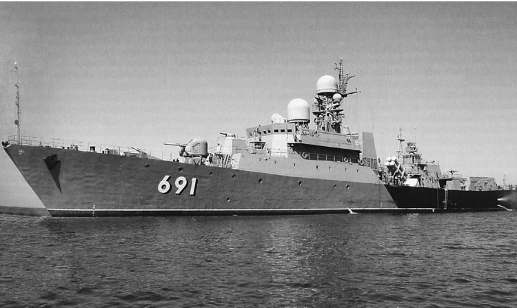
Российский военный фрегат готовы купить некоторые страны Юго-Восточной Азии