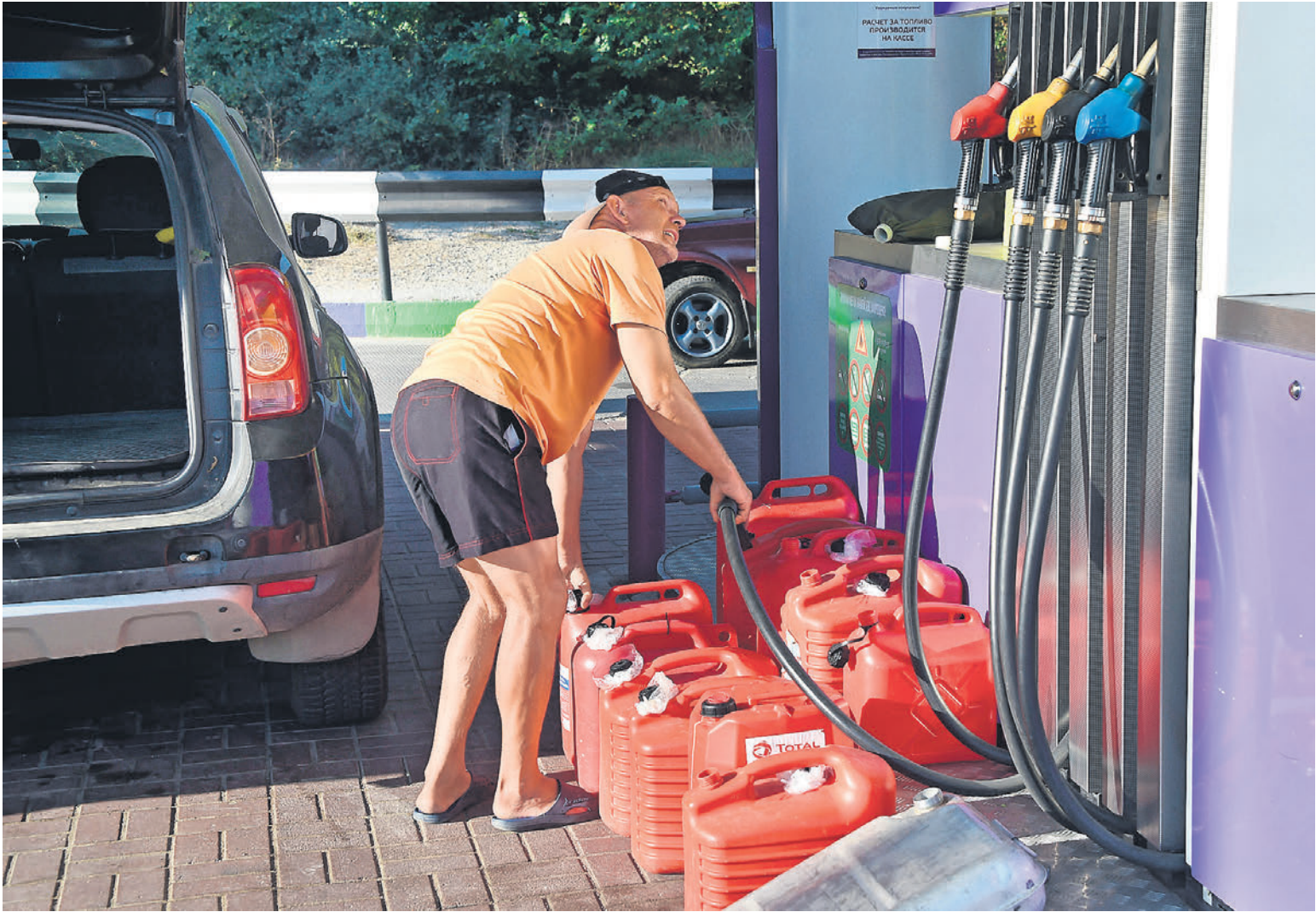
Растущее потребление бензина толкает вверх биржевые цены

Комментируя ситуацию, 15 июля господин Новак признал, что «несколько напряглась ситуация по бензину Аи-95, но мы эти вопросы решаем» (цитата по ТАСС). «Просто идет график ремонтов некоторых заводов, которые должны в ближайшее время выйти из ре-