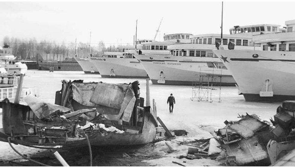
Речной транспорт требует радикального обновления

Пока идея находится в стадии проработки, и участвующие ведомства не готовы назвать сум-