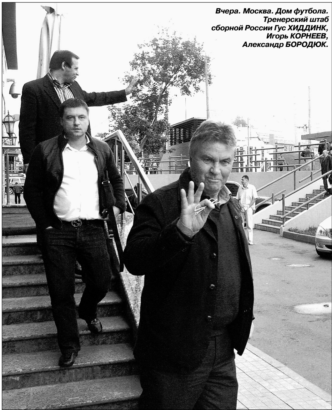
Вчера. Москва. Дом футбола. Тренерский штаб сборной России Гус ХИДДИНК, Игорь КОРНЕЕВ, Александр БОРОДЮК.

Сегодня сборная России начинает подготовку к отборочным матчам чемпионата мира против Лихтенштейна и Уэльса