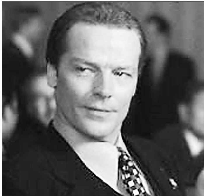
Иэн Глен в роли Рихарда Зорге

Впрочем, создатели идущего сейчас в Токио боевика «Шпион Зорге» сознательно решили погрешить против истины: в момент ареста герой чертовски элегантен, гладко выбрит, подтянут и самоуверен. Японская группа захвата даже вынуждена топтаться у дома разведчика, ожидая, пока его покинет шикарная блондинка на открытом автомобиле. В этом, конечно, есть доля истины — по материалам следствия, к Зорге в ночь ареста действительно кто-то приезжал на