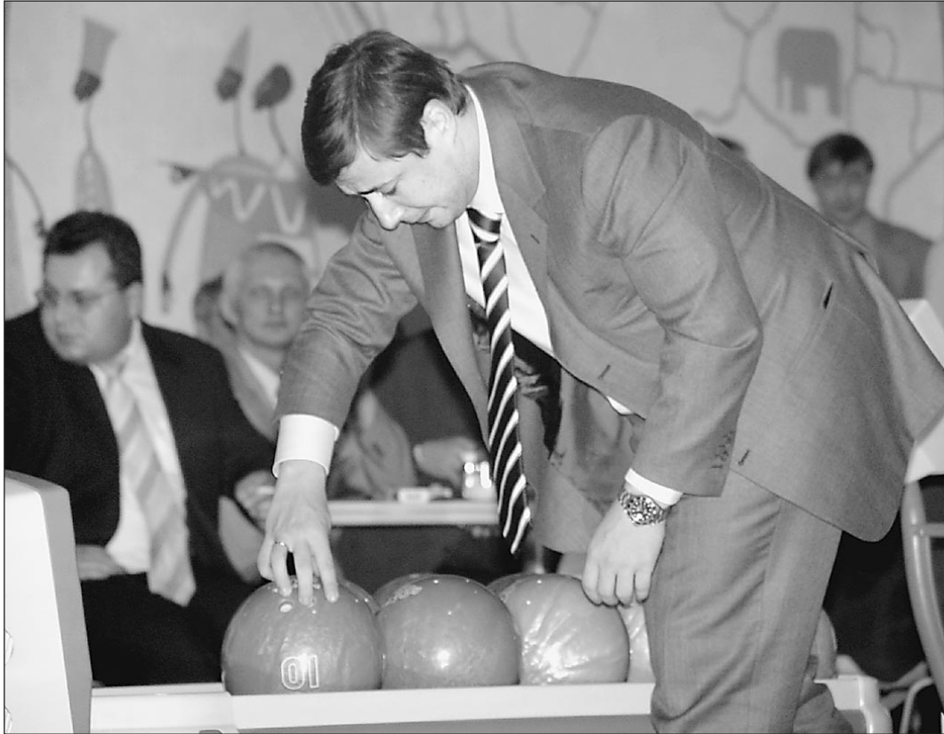
...губернатор Красноярского края Александр Хлопонин играет в боулинг...

Губернатор Свердловской области Эдуард Россель вместе с женой и внуком любит посещать курорты бывших соцстран и пляжи Арабских Эмиратов. Ежегодно гостит в Германии у своей дочери, которая вышла замуж за немца. Однако при этом всегда подчеркивает: