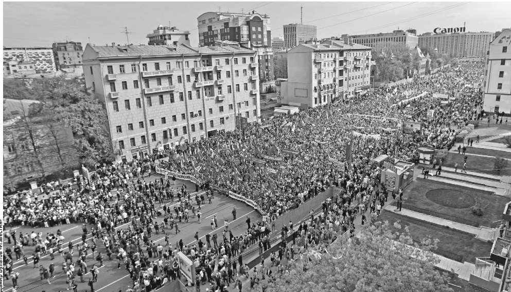
Май и декабрь предполагают разный формат проведения мероприятий на свежем воздухе