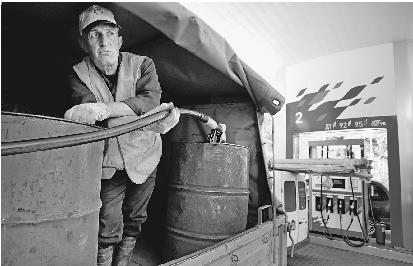
Надолго личных топливных запасов все равно не хватит

В зависимости от того, какой вариант примут, размер акциза, например, на бензин «Евро-5» увеличится на 957 рублей или 457 и составит 6,1 тыс. или