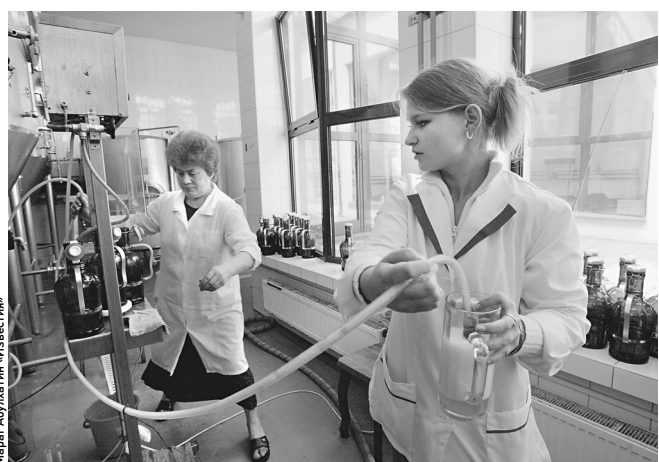
Между производителем и потребителем встанет счетчик

Пивоварни малой и средней мощности занимают в России 14% рынка, они производят в основном живое разливное пиво. Это около 700 предприятий, в том числе ресторанные пивоварни. Остальные 86% рын-