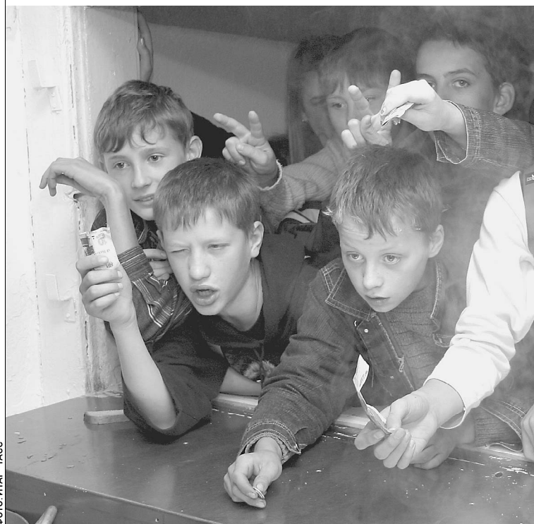
Обед в школьной столовой должны организовать так, чтобы толпы у раздачи не было

Сухомятка, избыток сладких, жирных, да и просто вредных для детского желудка блюд в меню школьных столовых и буфетов беспокоят не только родителей. Специалисты Роспотребнадзора, врачи, ученые давно с тревогой говорят о том же. → стр. 5