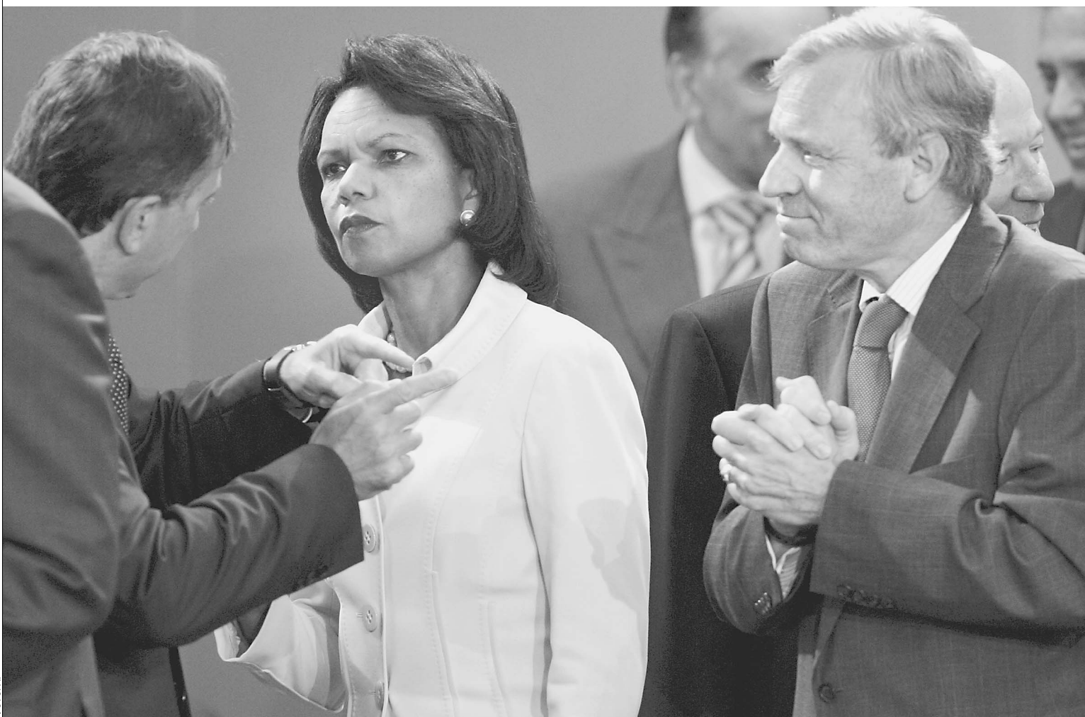
Госсекретарь США тщательно готовила свой бенедикс в Брюсселе, но он провалился

Вчера в Брюсселе состоялась экстренная встреча министров иностранных дел стран НАТО в связи с событиями вокруг Южной Осетии. Госсекретарь США Кондолиза Райс прибыла в штаб-квартиру альянса с особой миссией: найти способ, как «наказать Россию за вторжение в Грузию». Однако вопреки усилиям Вашингтона победела логика прагматизма.