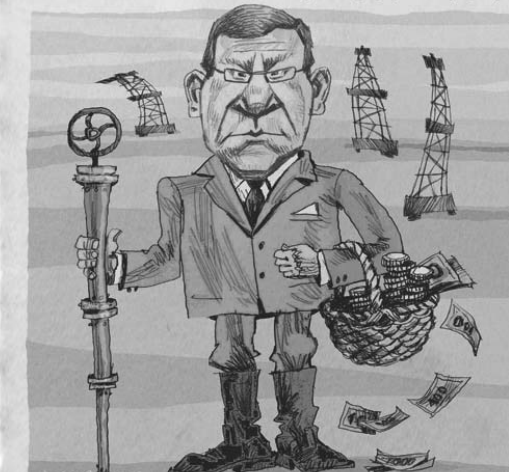
Есть ощущение, что, если предложение примет, фигура закрепится за министром финансов налогом

Вместе с сокращением пенсии нефтяников будут падать и доходы бюджета. Сильнее же сокращать расходы мы не можем. Хотя бы потому, что число пенсионеров растет с каждым годом. Не говоря уже о том, что надо бы существенно улучшить жизнь нынешних пенсионеров, прибавив пенсионные права до 1991 года. У них пенсии самые низкие. Просто раздавать деньги.