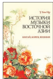
У Ген-Ир История музыки Восточной Азии (Китай, Корея, Япония). СПб.: Планета музыки, 2011. — 544 с.

5 Предлагаемая книга впервые в одном издании подробно знакомит российских читателей с историей и теорией, а также с некоторыми шедеврами традиционной музыки стран Восточной Азии (Китай, Корея, Япония), которые вместе составляют единый культурный ареал. Ранее этот пласт культуры оставался практически неизвестным у нас.