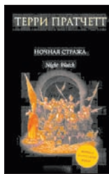
Пратчетт Т. Ночная стража / Пер. с англ. Н.Берденникова; Под ред. Н.Аллуна и А.Жикаренцева. М.: Эксмо; СПб.: Домино, 2011. — 528 с.

4 Это подлинная история самого Ночного из всех Ночных Дозоров. История анормпоркской Ночной Стражи. Вот только нашего героя зовут Сэм Ваймс, а не сами знаете как. Но про «треснул мир наполам» — это сущая правда. Ведь не будет, но будут монахи. Вампиров не будет, но будут убийцы. И будут убитые. И будут Свобода-Равенство-Братство, а когда возникает эта тройца, жди беды и, самое главное, крови.