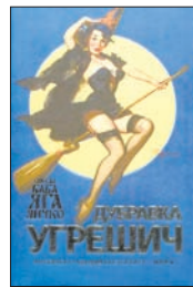
Угрешич Д. Снесла Баба-яга яйцо / Пер. с серб. Л.Савельевой. М.: Эксмо, 2011. — 448 с.