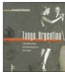
Габриэля Г. Tango Argentino\ Справочник начинающего тангера. М.: КноРус, 2011. — 128 с.

6 «Занятие или увлечение? Неизбежность или прихоть? Это надолго? Это пожизненно». Перед нами первая русскоязычная книга об аргентинском (остальные ненастоящие) танго. Автор рассматривает танец, как культурный феномен, возникший примерно в 1870-х годах в Буэнос-Айресе, на берегах великой реки Рио де ла Плата, и завоевавший весь мир.