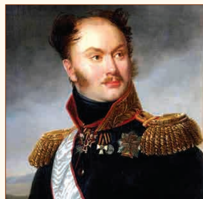
Портрет М.Ф. Орлова Художник А.-Ф. Ризенер, 1816—1817 гг.