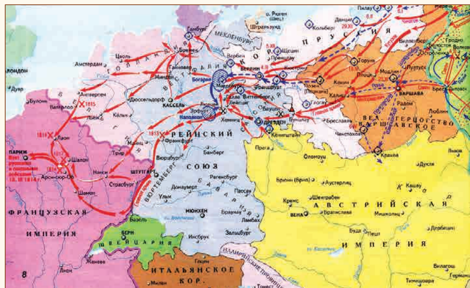
Заграничные походы русской армии 1813—1814 гг.