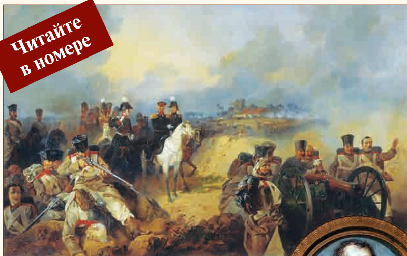
Сражение при Монмирале Художник М.О. Микешин, 1857 г.