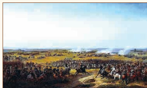
Сражение при Фер-Шампенуазе 13 марта 1814 г. Художник В.Ф. Тимм, 1839 г.