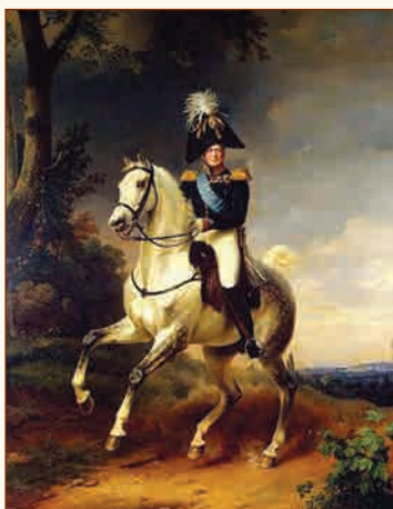
Портрет Александра I Художник Ф. Крюгер, 1838 г.

Подробнее об исторических событиях Заграничных походов русской армии 1813—1814 гг. читайте в статье С.Е. Лазарева «Военная кампания 1814 года во Франции».