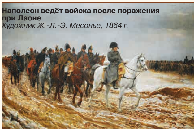
Наполеон ведёт войска после поражения при Лаоне Художник Ж.-Л.-Э. Месонье, 1864 г.