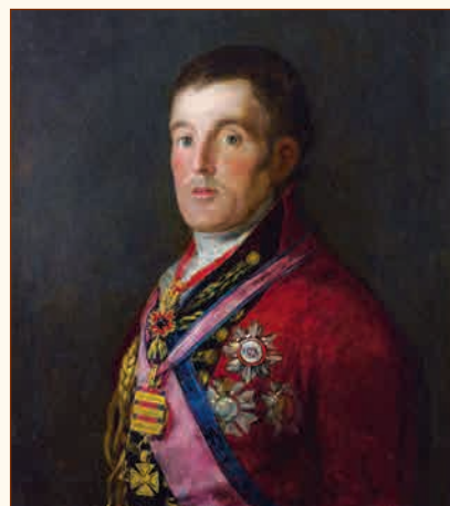
Портрет герцога Веллингтона (Артур Уэллсли) Художник Ф. Гойя